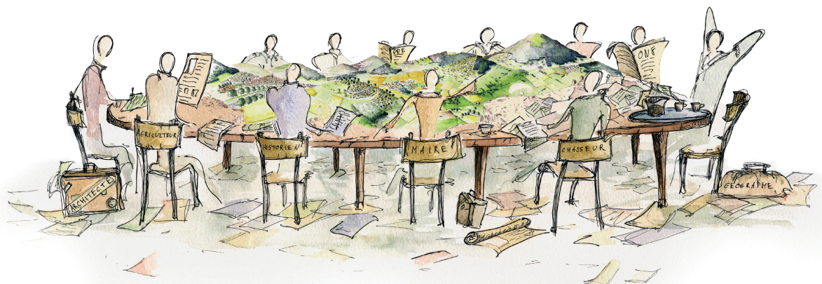
Figure 1 : Au centre du projet pédagogique de Bordeaux, le paysage comme objet de médiation. Illustration de Hubert Mansotte extraite de EnsapBx-CEPAGE, 2004, Enseigner le paysage. Le projet pédagogique de la formation des paysagistes dplg de Bordeaux , Talence, p.22.

La principale nouveauté pédagogique induite par une telle conception de l'action de l'action paysagiste réside dans la place donnée à l'apprentissage des méthodes de la recherche scientifique et plus généralement dans la connexion forte opérée dans les programmes entre recherche et projet :