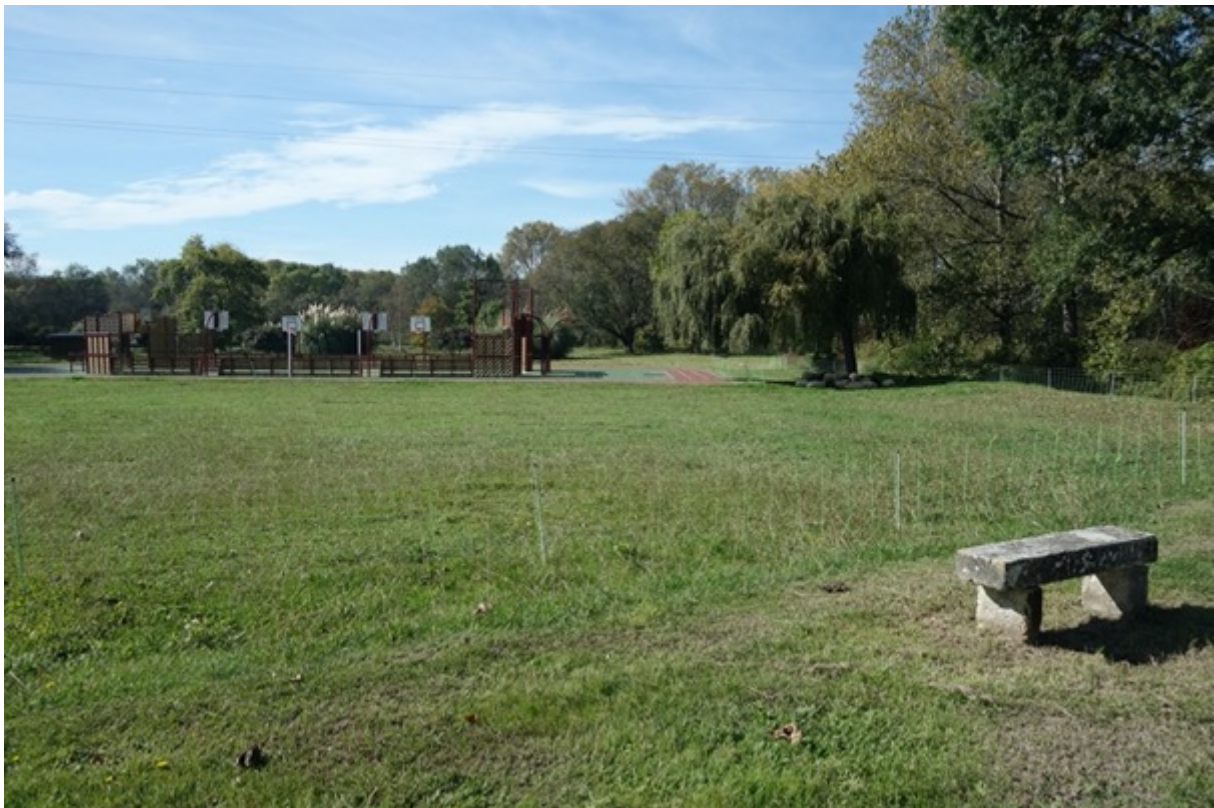
Figure 1 : « L'espace de loisir » de Labarde et ses grandes étendues de pelouse. A gauche, les équipements sportifs. A droite, sous le saule pleureur et au bord de la Laurina, les moutons se protègent du soleil de l'été indien. Au premier plan, un banc en pierre permet de contempler l'enclos du troupeau délimité par des barrières mobiles. © Rémy Bercovitz, 18 octobre 2021

pas le projet et opte pour une solution en régie. Dans cette perspective, elle se tourne vers la Chambre d'agriculture qui l'accompagne dans des démarches techniques et administratives qui consistent dans un premier temps à déterminer la charge pastorale 9 et obtenir un numéro d'éleveur. Le technicien agronome de la Chambre d'agriculture oriente également la commune vers le Conservatoire des Races d'Aquitaine. Cette association qui « œuvre pour la sauvegarde, le maintien et la valorisation des races et variétés d'élevage au service d'une économie locale et durable 10 » préconise d'utiliser un troupeau rustique de race landaise. La collectivité achète les animaux à un éleveur de la région et devient dès lors propriétaire d'un troupeau d'une vingtaine d'animaux. Grâce à l'accompagnement de la Chambre et du Conservatoire, l'agent technique de la commune acquiert les bons gestes zootechniques : soins et gestion sanitaire de bases, déplacement et hébergement du troupeau, nourriture et abreuvoir. En la matière, il reçoit également l'aide de l'éleveuse du château viticole voisin où, dans la dynamique impulsée par la commune, on a aussi décidé d'intégrer le pâturage dans l'entretien du domaine 11 . Depuis 2017, le service technique de la commune accumule de l'expérience, et a acquis assez de savoirs et de savoir-faire pour entretenir un troupeau dont le nombre de têtes varie entre quinze et vingt.