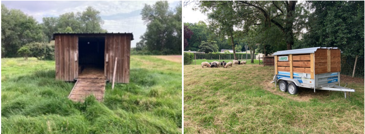
Figure 10 : Étables mobiles bricolées à partir de matériaux de récupération. © Fabien Reix, 27 juillet 2021