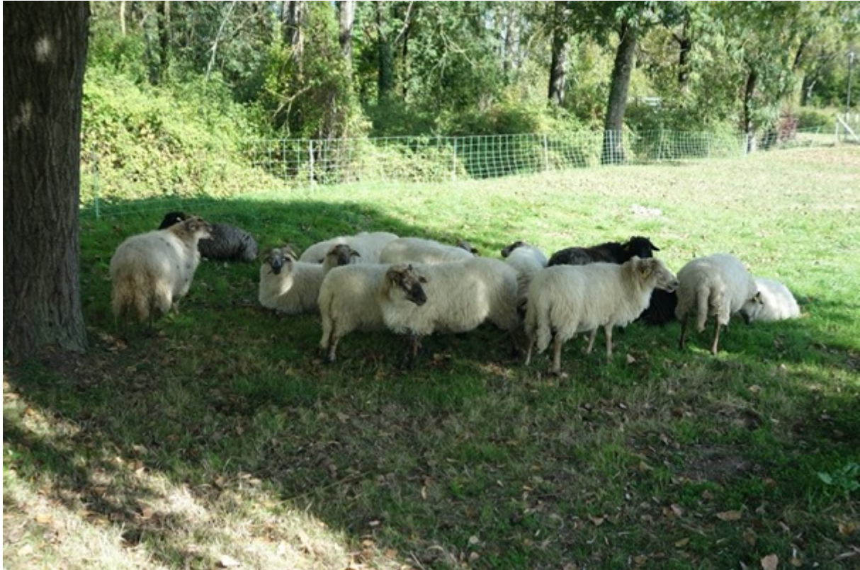
Figure 6 : Sous le saule pleureur et protégé par les barrières mobiles, le troupeau bien entretenu de moutons landais. © Rémy Bercovitz, 18 octobre 2021

Faisons également l'hypothèse que la « cohabitation entre les hommes et les animaux 18 » a été favorisée par la bonne tenue du troupeau (Figure 6). Les animaux sont en bonne santé et « bien gras 19 ». Ils présentent une laine propre et ne semblent manquer de rien. Le bien-être animal constitue à n'en pas douter un facteur clef d'acceptation de ces nouveaux venus.