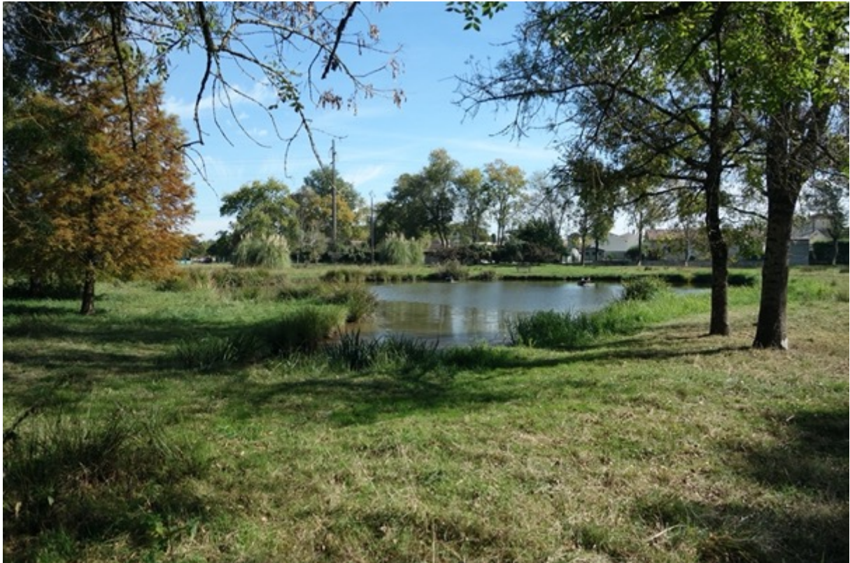
Figure 4 : Bucolique et sauvage, l'autre facette du parc. © Rémy Bercovitz, 18 octobre 2021

Ce que ce mode d'entretien a profondément fait évoluer, c'est l'appropriation sociale des lieux. Si les enseignants de l'école primaire toute proche continuent d'utiliser les équipements sportifs pour leurs activités pédagogiques, ils organisent désormais de nombreuses sorties au cours de l'année autour des moutons : lors de la tonte annuelle ou à l'occasion du déplacement des animaux, les enfants sont amenés à participer à la vie du troupeau. Dans cette perspective pédagogique, la partie enherbée de la cour de l'école est d'ailleurs entretenue par les moutons. Les riverains s'impliquent également 13 . Certains d'entre eux surveillent les animaux et préviennent les équipes municipales lorsqu'un audacieux réussit à passer les barrières ou veillent à ce que l'on ne nourrisse pas intempestivement les animaux. Singulièrement, les membres de la société de chasse s'investissent aussi dans la vie de ce nouvel espace public : ils ont introduit des canards sur l'étang et « classé » le site en réserve de chasse. Le troupeau est désormais prétexte à la promenade et fait l'objet de toutes les discussions 14 . Tout se passe comme si l'introduction des moutons avait favorisé le contact entre les habitants qui ont désormais ces animaux en partage. De ce mode de gestion, un nouvel espace social est né.