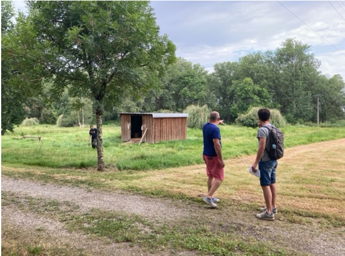
Figure 11 : Un simple coup d'œil permet de voir que l'éco-pâturage génère des milieux et des habitats très différents des méthodes conventionnelles. Pourtant, aucune donnée objective n'est à notre disposition pour démontrer les bénéfices écologiques d'une telle opération. © Fabien Reix, 27 juillet 2021