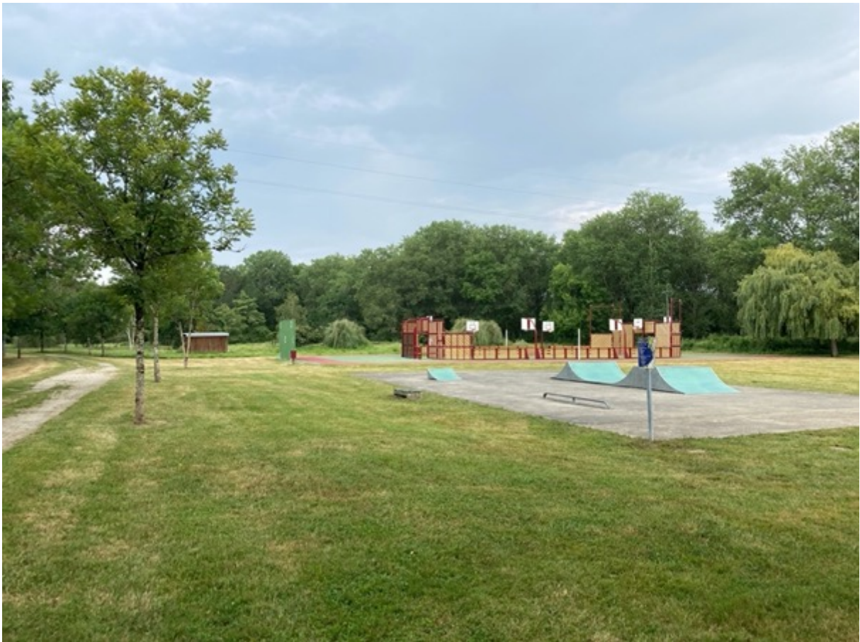
Figure 3 : Aux abords des équipements sportifs, un parc aux allures "d'espaces verts". © Fabien Reix, 27 juillet 2021

Ce nouveau mode de gestion a profondément transformé l'organisation de l'espace qui, la majorité du temps, est désormais coupé en deux. Au nord, le terrain est dédié aux équipements sportifs. Ici, les machines continuent d'entretenir le terrain qui est pleinement accessible (Figure 3). Au sud, sur l'ancien parcours de santé dont on découvre aujourd'hui encore des vestiges, l'espace est pâturé par le troupeau qui est contenu grâce à des barrières mobiles (Figure 4). Deux paysages sont nés de ce nouveau dispositif d'entretien. Le premier relève d'un « modèle paysager institutionnel 12 » qui est celui des espaces verts hérités de l'après-guerre renvoyant à l'idéal d'une nature équipée et d'une urbanité policée. Le second fait plutôt écho à une esthétique bucolique et sauvage qui met en scène un système local, vivant et mouvant. Ces deux paysages se confrontent. A première vue, s'opèrent entre eux des formes de compartimentation.