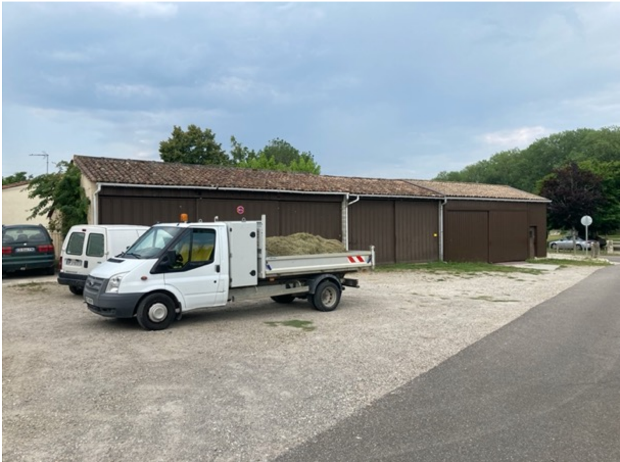
Figure 9 : Camionnette chargée de foin devant l'étable fixe construit dans le local technique. Le bricolage et la débrouille est au cœur du projet d'éco-pâturage de Labarde. © Fabien Reix, 27 juillet 2021

Ce qui est ici particulièrement remarquable c'est l'économie de moyen avec laquelle le projet d'éco-pâturage a été mis en œuvre par une équipe municipale au budget contraint. L'acquisition du troupeau a tout d'abord permis de limiter fortement l'usage des machines et par conséquent l'achat de gasoil. L'ancien hangar de stockage des machines, désormais devenu trop grand, a permis de réaliser une bergerie fixe et bien équipée pour accueillir les animaux lorsque les conditions climatiques l'exigent (Figure 9). L'agent technique responsable du troupeau a également construit deux étables mobiles en réutilisant le châssis d'anciens véhicules, quelques planches de bois ou encore des morceaux de tôle trouvés aux abords du bourg 20 (Figure 10). Récupération et recyclage sont au cœur d'un projet qui a profondément modifié son travail. Détenteur de nouveaux savoir-faire, il est devenu en partie berger et passe désormais moins de temps sur les machines et plus au contact des animaux et des usagers. Entre gestion d'espaces verts et élevage, l'éco-pâturage constitue une « activité d'interface » qui nécessite de mettre en perspective des connaissances zootechniques, des savoirs sur les milieux et les dynamiques végétales ou encore des formes de médiations avec le public et les usagers 21 . Le technicien municipal confie être plus épanoui dans ce nouveau travail.