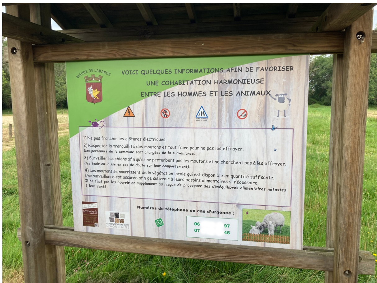
Figure 5 : Le panneau d'information installé par l'équipe municipale lors de l'installation du troupeau constitue un des dispositifs qui permet la cohabitation entre les animaux et les habitants. © Fabien Reix, 27 juillet 2021

Si les riverains et les habitants ont rapidement accepté les nouveaux venus, et que l'on n'a pas réellement eu à enregistrer de plaintes relatives au bruit ou aux odeurs du troupeau, c'est grâce tout d'abord à l'investissement des équipes municipales. Les élus et les techniciens ont expliqué la démarche et ses bienfaits, directement sur le terrain, dans le bulletin municipal 15 ou encore à travers un panneau d'information qui, installé aux abords des stationnements, explique les modes de coexistence (Figure 5). En septembre 2018, on a bien eu à déplorer le vol de deux agneaux. Situation qui a suscité l'émoi des équipes municipales et a trouvé un écho dans la presse régionale 16 mais qui ne s'est pas reproduite depuis. Fait remarquable, il n'y a, pour l'instant, jamais eu de problèmes avec d'autres animaux et notamment avec les chiens des riverains ou des visiteurs de passage 17 .