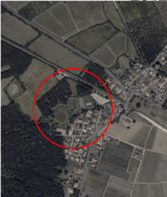
Figure 2 : Les étapes de construction de l'« espace de loisir » de Labarde.

Dans les années 1970, les premiers pavillons sont édifiés alors que le parc n'est encore qu'une prairie de fauche. Dans le cadre du plan de réhabilitation des palus (1997), un aménagement voit le jour : cheminements et stationnements, équipements sportifs et étang de loisir. Les années 1990 correspondent également au développement de l'habitat sous la forme de pavillons. Le cliché de 2012 montre l'état du parc public trois ans avant que soient mises en place les premières expériences d'éco-pâturage.