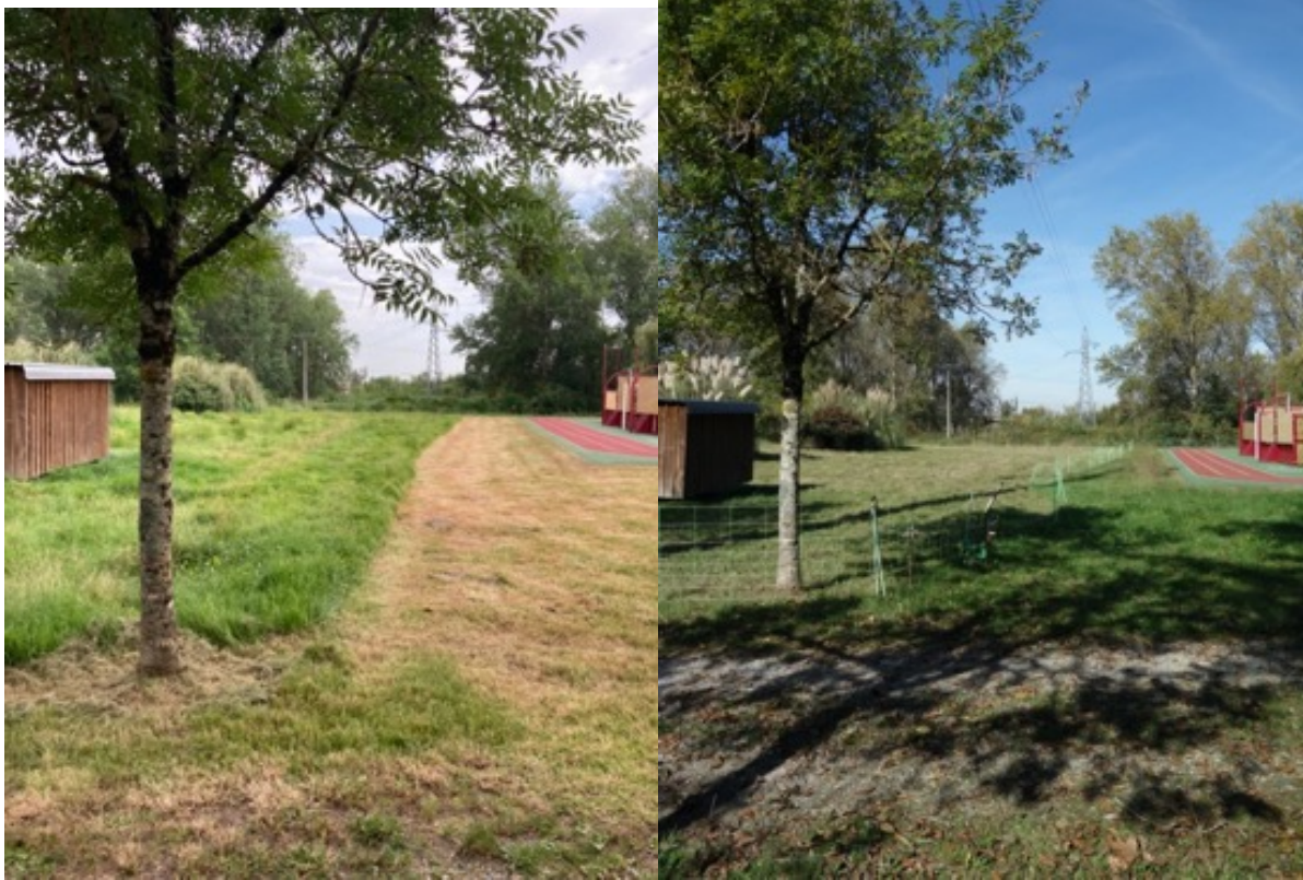
Figure 7 : Au gré du déplacement des animaux, l'espace change. Les barrières sont déplacées et l'espace devient accessible ou pas.

du parcours des animaux, au fil des saisons et des usages. Il génère des formes évolutives que l'on ne peut et que l'on ne cherche pas à maîtriser totalement. Par ailleurs, ce que la barrière mobile a fait exister et institué, c'est un nouveau groupe d'utilisateurs : les animaux. Ce dispositif évolutif a en effet permis qu'ils aient accès à cet espace public, y aient le droit de cité ainsi que d'y apporter leur part. Ici l'articulation des usages dans l'espace a nécessité qu'on le délimite. Cela n'a pas engendré des camps retranchés, mais au contraire rendu possible la cohabitation.