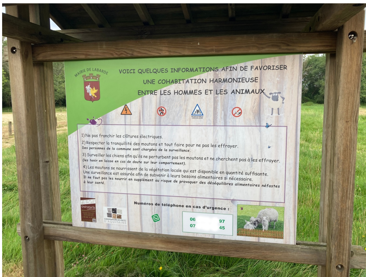
Figure 5 : Le panneau d'information installé par l'équipe municipale lors de l'installation du troupeau constitue un des dispositifs qui permet la cohabitation entre les animaux et les habitants. © Fabien Reix, 27 juillet 2021

Si les riverains et les habitants ont rapidement accepté les nouveaux venus, et que l'on n'a pas réellement eu à enregistrer de plaintes relatives au bruit ou aux odeurs du troupeau, c'est grâce tout d'abord à l'investissement des équipes municipales. Les élus et les techniciens ont expliqué la démarche et ses bienfaits, directement sur le terrain, dans le bulletin municipal 15 ou encore à travers un panneau d'information qui, installé aux abords des stationnements, explique les modes de coexistence (Figure 5). En septembre 2018, on a bien eu à déplorer le vol de deux agneaux. Situation qui a suscité l'émoi des équipes municipales et a trouvé un écho dans la presse régionale 16 mais qui ne s'est pas reproduite depuis. Fait remarquable, il n'y a, pour l'instant, jamais eu de problèmes avec d'autres animaux et notamment avec les chiens des riverains ou des visiteurs de passage 17 .