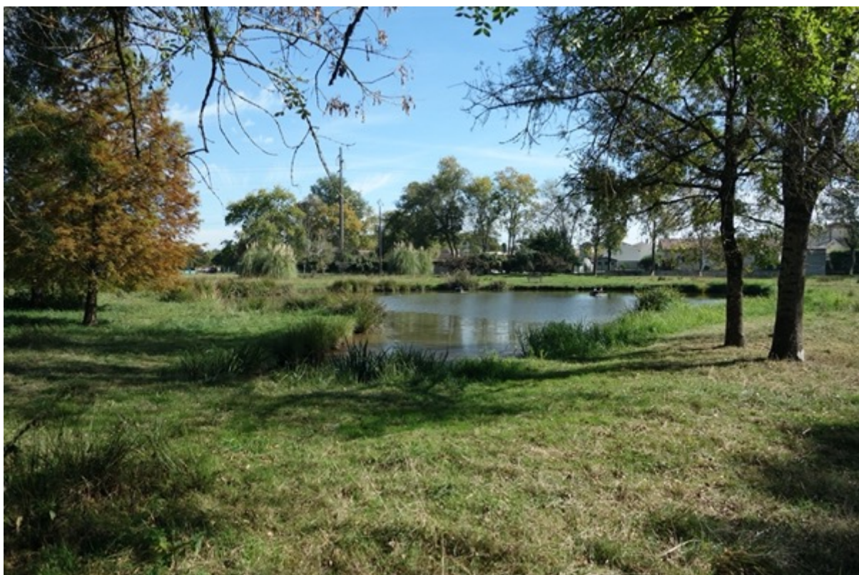
Figure 4 : Bucolique et sauvage, l'autre facette du parc. © Rémy Bercovitz, 18 octobre 2021

Ce que ce mode d'entretien a profondément fait évoluer, c'est l'appropriation sociale des lieux. Si les enseignants de l'école primaire toute proche continuent d'utiliser les équipements sportifs pour leurs activités pédagogiques, ils organisent désormais de nombreuses sorties au cours de l'année autour des moutons : lors de la tonte annuelle ou à l'occasion du déplacement des animaux, les enfants sont amenés à participer à la vie du troupeau. Dans cette perspective pédagogique, la partie enherbée de la cour de l'école est d'ailleurs entretenue par les moutons. Les riverains s'impliquent également 13 . Certains d'entre eux surveillent les animaux et préviennent les équipes municipales lorsqu'un audacieux réussit à passer les barrières ou veillent à ce que l'on ne nourrisse pas intempestivement les animaux. Singulièrement, les membres de la société de chasse s'investissent aussi dans la vie de ce nouvel espace public : ils ont introduit des canards sur l'étang et « classé » le site en réserve de chasse. Le troupeau est désormais prétexte à la promenade et fait l'objet de toutes les discussions 14 . Tout se passe comme si l'introduction des moutons avait favorisé le contact entre les habitants qui ont désormais ces animaux en partage. De ce mode de gestion, un nouvel espace social est né.