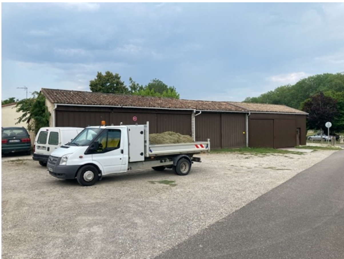
Figure 9 : Camionnette chargée de foin devant l'étable fixe construit dans le local technique. Le bricolage et la débrouille est au cœur du projet d'éco-pâturage de Labarde. © Fabien Reix, 27 juillet 2021

Ce qui est ici particulièrement remarquable c'est l'économie de moyen avec laquelle le projet d'éco-pâturage a été mis en œuvre par une équipe municipale au budget contraint. L'acquisition du troupeau a tout d'abord permis de limiter fortement l'usage des machines et par conséquent l'achat de gasoil. L'ancien hangar de stockage des machines, désormais devenu trop grand, a permis de réaliser une bergerie fixe et bien équipée pour accueillir les animaux lorsque les conditions climatiques l'exigent (Figure 9). L'agent technique responsable du troupeau a également construit deux étables mobiles en réutilisant le châssis d'anciens véhicules, quelques planches de bois ou encore des morceaux de tôle trouvés aux abords du bourg 20 (Figure 10). Récupération et recyclage sont au cœur d'un projet qui a profondément modifié son travail. Détenteur de nouveaux savoir-faire, il est devenu en partie berger et passe désormais moins de temps sur les machines et plus au contact des animaux et des usagers. Entre gestion d'espaces verts et élevage, l'éco-pâturage constitue une « activité d'interface » qui nécessite de mettre en perspective des connaissances zootechniques, des savoirs sur les milieux et les dynamiques végétales ou encore des formes de médiations avec le public et les usagers 21 . Le technicien municipal confie être plus épanoui dans ce nouveau travail.