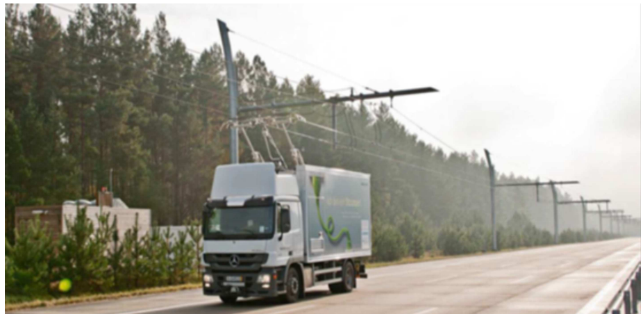
Figure 1 : Alimentation d'un PLH par un système de caténaires

L'utilisation de PL 100 % électriques n'est pas envisageable sur de longues distances, même à moyen terme, en raison du poids et du volume des batteries qui seraient nécessaires. Nous analysons donc l'option hybride, où des PLH de 40 t fonctionneraient avec des moteurs électriques sur des infrastructures dédiées et au diesel pour les trajets amont et aval. Différentes technologies existent pour alimenter les PLH en électricité. Le recours à des caténaires est préférable aux options par induction ou par contact au sol, tant pour des raisons financières, que de sécurité routière ou d'efficacité énergétique 7 (AKERMAN, 2016 ; NG YUK SHING, 2015 ; CARBONE 4, 2017 ; FRAGNOL, 2017). L'alimentation électrique se fait par des caténaires suspendues au dessus des routes et reliés aux PLH à l'aide d'un pantographe (Figure 1). L'utilisation de moteurs hybrides permet de ne pas dégrader les vitesses des PL et les autorise à doubler d'autres véhicules. Quand le pantographe n'est pas en contact avec le câble électrique, le moteur à combustion se met ainsi en marche et, le temps que ce dernier démarre, l'énergie est fournie par une batterie. L'infrastructure électrique comprend également des sous-stations pour abaisser la tension et convertir le courant alternatif en courant continu, ce qui évite d'avoir de lourds transformateurs sur les PL et de réduire leur charge utile.