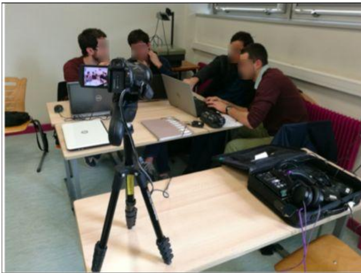
Fig. 2 Travail de groupe en gestion d'entreprise

La photo ci-dessous montre le dispositif d'enregistrement pour les TD Gestion d'entreprise : une caméra est placée en face du groupe observé composé des 4 élèves et chaque élève porte un micro-cravate.