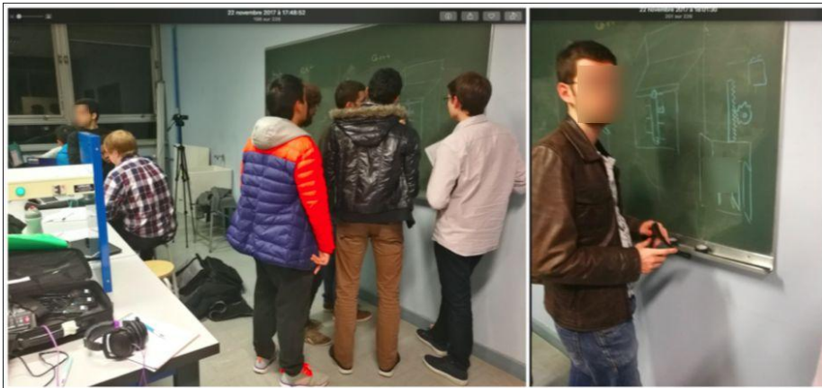
Fig. 3 Travail de groupe du projet Robotique

Pour le projet de robotique, les interactions verbales entre les élèves sont souvent combinées aux objets qu'ils manipulent. Outre les objets, leurs gestes participent aussi souvent aux interactions. L'extrait suivant montre qu'il est indispensable de voir les gestes du locuteur pour pouvoir comprendre son discours. Quelques élèves discutent en dessinant sur un tableau et essaient de trouver une solution pour construire un robot.