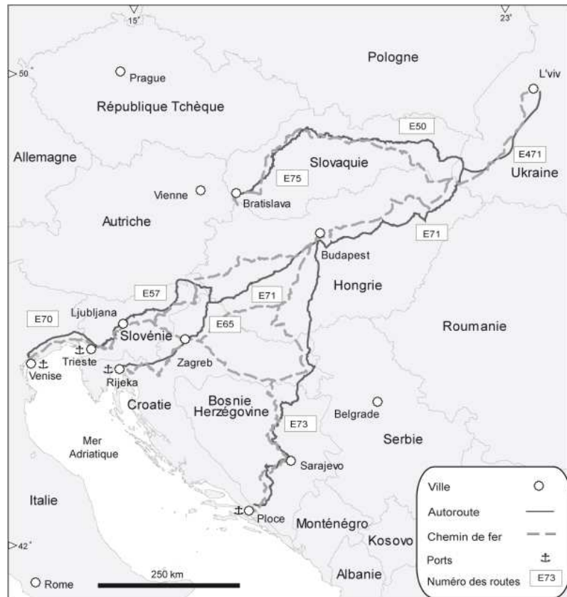
Figure 1 : Grands corridors ferroviaires et routiers d'Europe de l'Est : l'exemple du Pan-European corridor n° 5