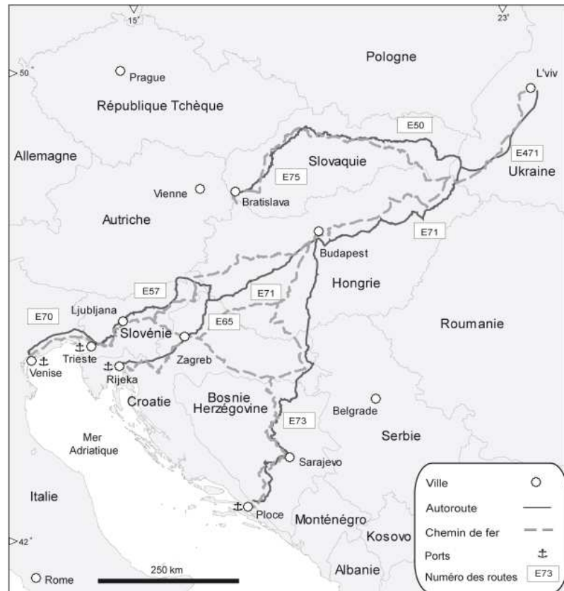
Figure 1 : Grands corridors ferroviaires et routiers d'Europe de l'Est : l'exemple du Pan-European corridor n° 5