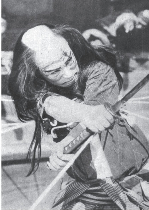
Illustration de couverture : Denjirō Ōkōchi dans Rancune profonde ( Chōkon , Daisuke Itō, Nikkatsu, 1926)