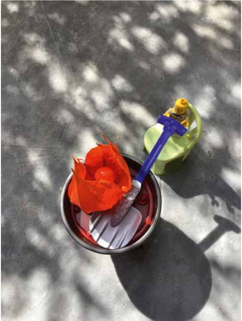
Les solitudes laborieuses – Collectif CrrC