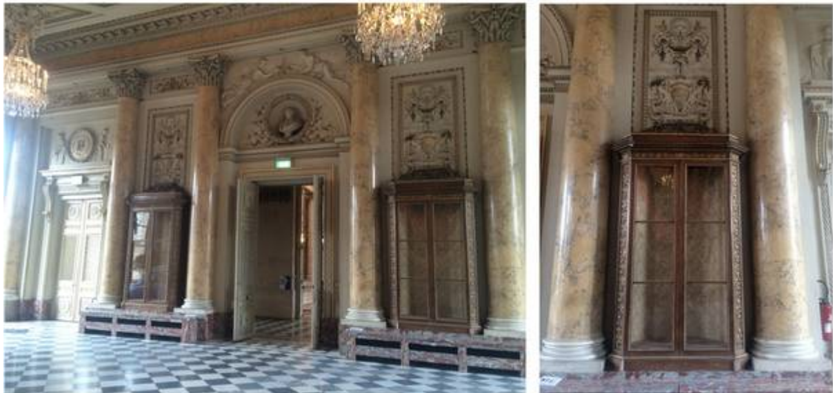
Fig. 3 e 4. Deux des quatre armoires de la collection minéralogique encadrant de la porte d'entrée ; les deux autres sont situées, symétriquement, en face de la porte, de part et d'autre de la cheminée. On peut voir aussi les décors en stucs et gypse à motifs de vases et guirlandes, ainsi que les différents couleurs du marbre et des stucs qui l'imitent utilisés pour les colonnes.

national , revient régulièrement dans les récits et guides de voyage, et le succès de la collection ne fait pas de doute : en 1844 encore, alors qu'il n'y a plus ni d'École des mines, ni de cabinet de minéralogie dans l'hôtel de la Monnaie, les sources mentionnent celui-ci : certes une erreur, mais qui prouve la fortune de cette collection et celle du lieu qui l'abritait 24 .