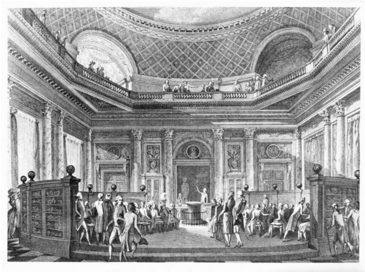
Fig. 1. François-Denis Née, Le cabinet de l'hôtel des Monnaies , 1789, gravure. Médiathèque de l'hôtel de la Monnaie, Paris. Cette gravure montre, outre les décors du salon d'honneur et l'agencement de la collection, la manière dont se déroulaient les cours de Sage (debout au fond) et le public qui les fréquentait, majoritairement des aristocrates mais aussi des dames et des ecclésiastiques

collection, désormais nationale, le plus riche et le plus beau cadre possible. L' Almanach national , qui consacre une colonne au « Musée des Mines à la Monnaie » à partir de 1801, s'en fait l'écho : « Le citoyen Sage s'est spécialement occupé à mettre de l'ordre dans cette collection ; il a disposé circulairement à l'extérieur de l'amphithéâtre des armoires qui renferment presque tout ce qui est connu en minéralogie ; il en a publié une description méthodique [...] le C. Sage a recueilli des marbres, des porphyres, des granites rares dont il a fait faire, à ses frais, de tables qui décorent les galeries. Le salon où est le musée des mines a été décoré d'après les dessins de M. Antoine, architecte célèbre ; les sculptures sont de M. Gois ; les peintures de M. Renou et celles qui imitent les camées sont de M. Fort 21 ».