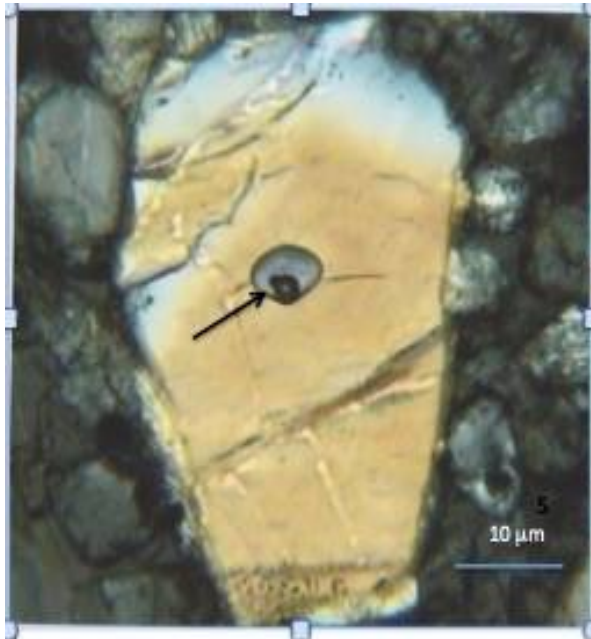
Fig. 1 : Inclusion vitreuse dans une olivine de Semarkona (L6 chondrite). (Tronche et al., 2007)

dant cette période, un (ou des) bref(s) épisode(s) de haute température refond(ent) tout ou partie des poussières existantes. (Site Internet Planet-Terre, ENS-Lyon).