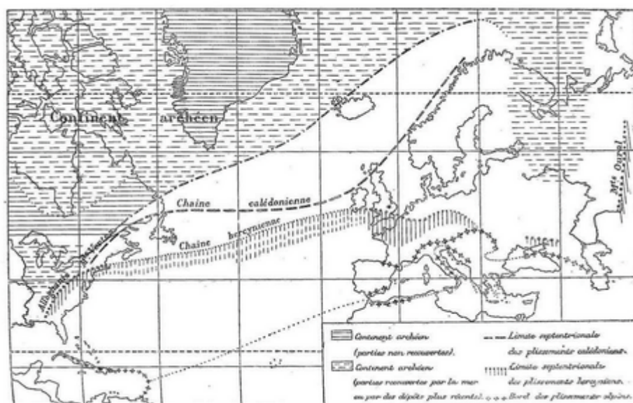
Fig. 1. En haut : disposition des chaînes européennes calédonienne et hercynienne au nord de la chaîne alpine. En bas : prolongement des chaînes européennes en Amérique du Nord. D'après Marcel Bertrand, 1887

forces insuffisantes : « force répulsive du pôle ou poussée vers l'équateur », mouvement vers l'ouest attribué aux marées. Toutes forces, dit un