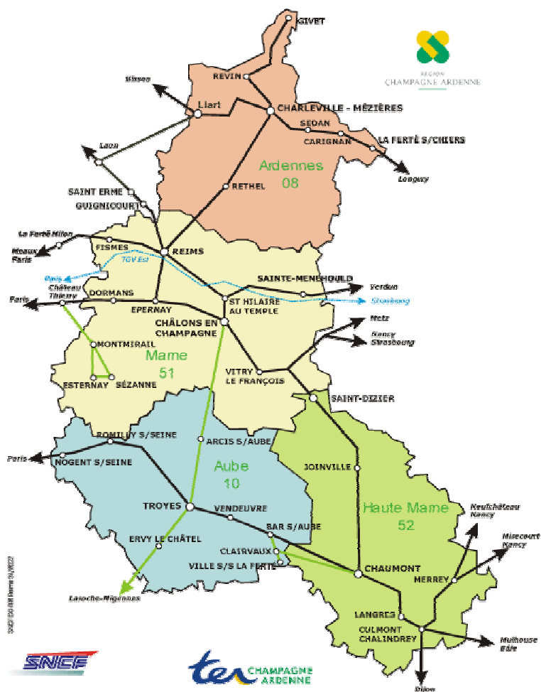
Carte 1 : Carte de la région Champagne Ardenne

La région Champagne-Ardenne, composée de quatre départements (les Ardennes au Nord, l'Aube au Sud, la Haute-Marne au Sud-Est et la Marne au centre ; Carte 1) est une région éclatée d'un point de vue géographique et économique. L'Aube est attirée par la Bourgogne et l'Île-de-France, la Haute-Marne, qui se trouve dans une situation encore plus excentrée que l'Aube, est attirée d'un côté par la Lorraine et de l'autre par la Franche-Comté et la Bourgogne. L'absence d'une jonction ferroviaire entre le Nord et le Sud de la région renforce les forces centripètes. L'ensemble des franges de la Région est tourné vers les régions limitrophes.