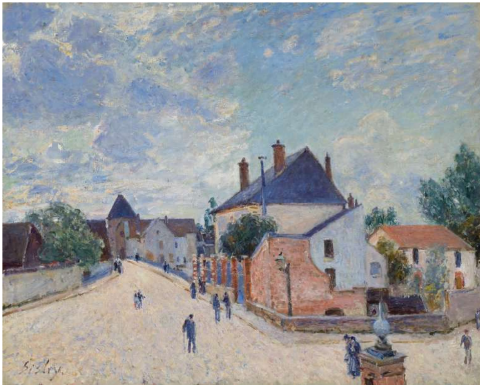
Rue à Moret-sur-Loing, vers 1890. The Art Institute of Chicago.

lecteurs s'amuser, comme je l'ai moi-même fait, à rechercher dans le Catalogue de Brame et Lorenceau, par exemple, les « chemins finement tracés » qui pourraient mériter de tels qualificatifs. Suggérons-leur, pour rester dans la région, « Chemin près du parc de Courances », où plusieurs chemins font serpenter leur tracé auprès de la forêt ; « Rue à Moret-sur-loing », au tracé et aux couleurs d'une délicatesse qu'une Berthe Morizot n'aurait pas désavouée ; « La route de Veneux-Nadon » ; « Paysage de printemps aux environs de Moret-sur-Loing »... 17