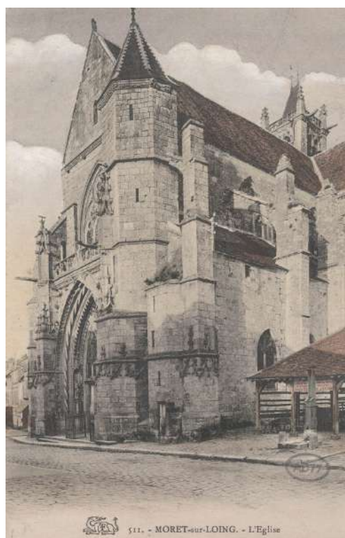
Carte postale de 1908, sans doute semblable à celle reçue par Proust.

Laquelle des treize ou quatorze représentations de l'église peintes par Sisley en 1893 et 1894 a-t-il en tête ? Jean-Yves Tadié tranche en faveur de celle, détenue depuis le début du XX e siècle par le Musée du Petit Palais, que le Catalogue critique de Sylvie Brame et François Lorenceau répertorie sous le simple titre : « L'église de Moret sur Loing 7 ». Les visiteurs de Moret peuvent en voir une reproduction sur la plaque de céramique installée face à l'église, à l'angle de la rue de l'Église et de la rue du Puits du Four. Mais notre auteur n'explicite pas les raisons de son choix ; il cite simplement les phrases liminaires de la lettre du 27 novembre 1904 en plaçant après « portrait par Sisley » un appel à une note ainsi libellée : « Aujourd'hui au Petit Palais. Catalogue de l'exposition BN 1965, n° 287. »