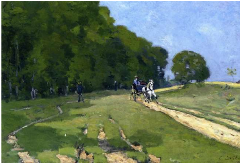
Chemin près du parc de Courances, 1868. Collection particulière.

Et c'est tout pour Sisley. Il semble n'être apparu que pour faire la transition entre Monet et Corot, qui l'un et l'autre reçoivent un traitement beaucoup plus généreux. On aimerait connaître les tableaux « clairs et caressants » où le narrateur, et Proust avec lui sans doute, ont vu des « chemins finement tracés » et une « douceur précieuse de femme ». Il ne s'agit certainement pas des représentations de l'église de Moret, auxquelles ces épithètes s'appliqueraient assez mal. Je laisse les