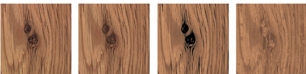
FIGURE 2 – Image originale (gauche), reconstruction par AE (centre gauche), reconstruction par AE discretisé (centre droit) et restauration par AE discretisé (droite)

Nous comparons nos modèles avec deux méthodes de l’état de l’art parmi les plus performantes pour la détection d’anomalie sur MVTecAD : PaDiM [2] et FastFlow [6]. Ces deux modèles reposent sur l’extraction de caractéristiques des images par un réseau de convolutions (ici un ResNet50) et la modélisation de leur distribution par des mixtures de gaussiennes multivariées pour le premier, et un modèle de Normalizing Flow pour le second. L’implémentation des modèles est faite grâce à la bibliothèque Anomalib [4].