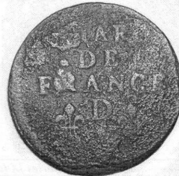
Liard de France (2 e type) de Louis XIV (Vimy/Neuville-sur-Saône, 1656).