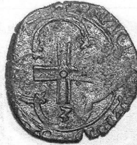
Double tournois du Dauphiné à la croissette de François I er (Grenoble, 1543-1547).