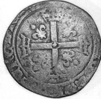
Karolus de Charles VIII (atelier de Tours ou d'Angers, 1488-1498).