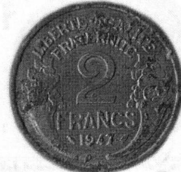
2 francs « Morlon » République Française (1947) (campagne de fouilles 2001).