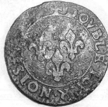
Double tournois de Louis XIII (probablement atelier de Poitiers, entre 1626 et 1628).