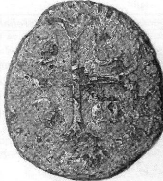
Douzain de Charles IX (atelier indéterminé, 1560-1574).