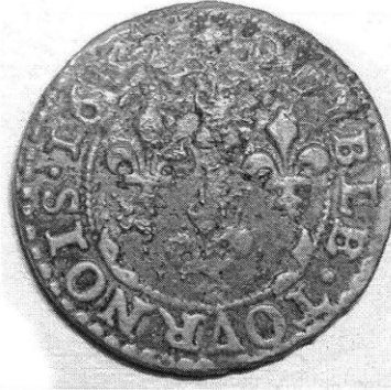
Double tournois de Frédéric-Maurice de la Tour d'Auvergne, prince souverain de Sedan (Givonne, 1632).