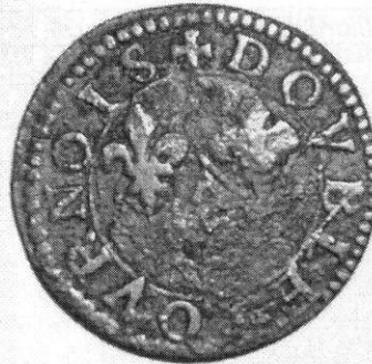
Double tournois de François de Bourbon de Conti, prince souverain de Château-Regnault (atelier de Château-Regnault ou La Tour-à-Glaire-Sedan) (frappe posthume, 1615-1629).