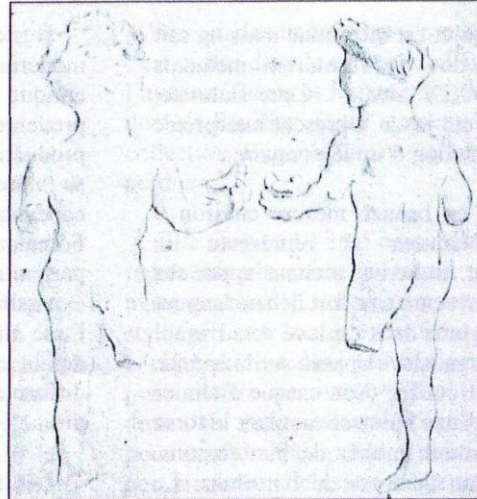
Fig. 3 (d'après BGASM , 10, 1969, pl. V).