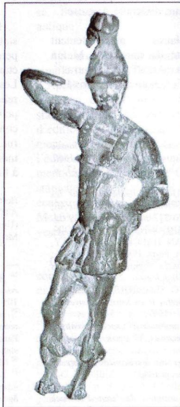
Fig. 4 : Dieu Mars du musée de Melun