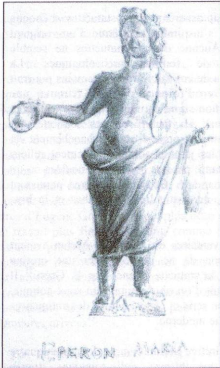
Fig. 1 (d'après BGASM , 10, 1969, pl. V).