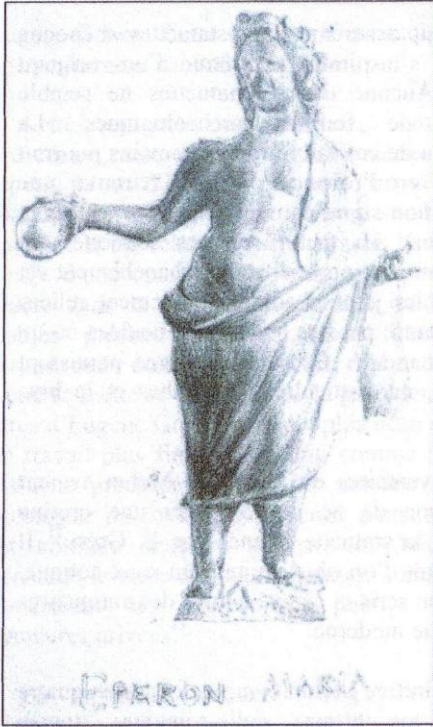
Fig. 1 (d'après BGASM , 10, 1969, pl. V).