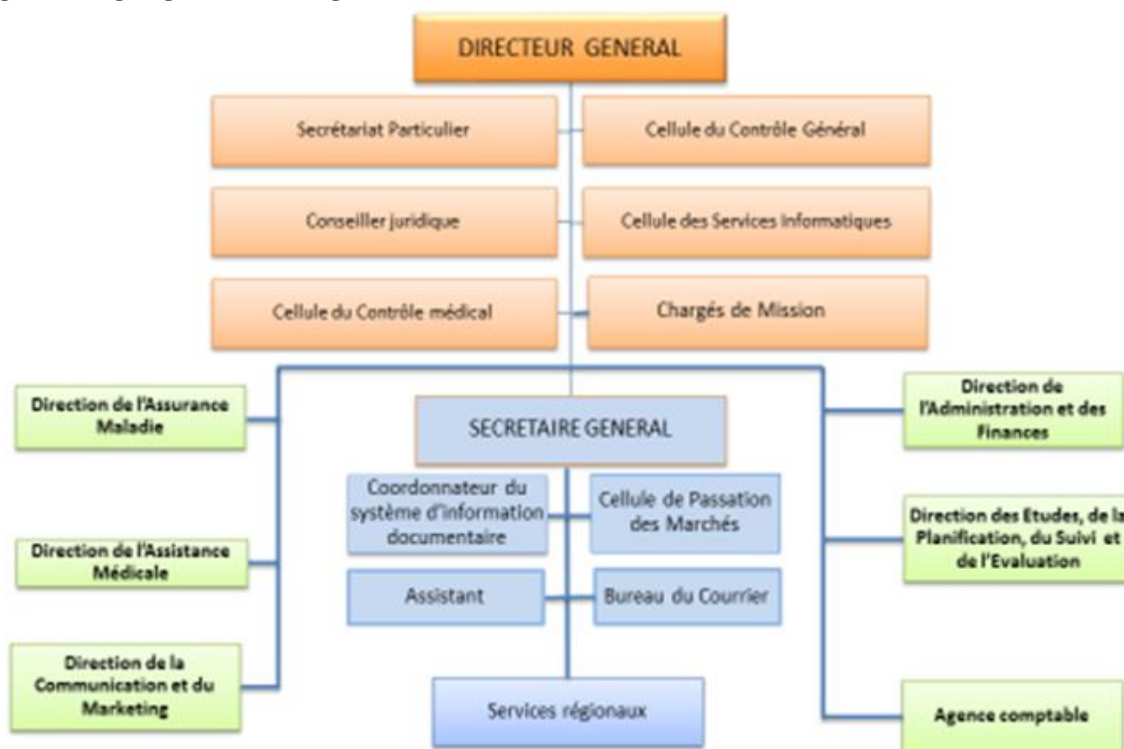
Figure 2. Organigramme de l'Agence de la CMU