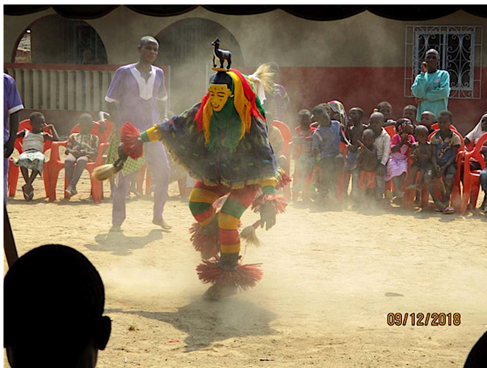
Figure 3 : Zauoli, danse d'amusement lors de fête de levée de deuil en 2018 dans le village de Bogopinfla