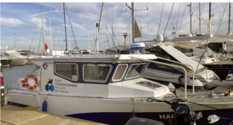
Figure 3. L'Haliotis à quai dans la marina de Porto Ercole

Grâce à la faible teneur en gaz des sédiments, il a été possible d'imager avec une résolution verticale de 7,5 centimètres l'empilement des couches sous le fond vaseux jusqu'à huit mètres de profondeur (Figure 2).