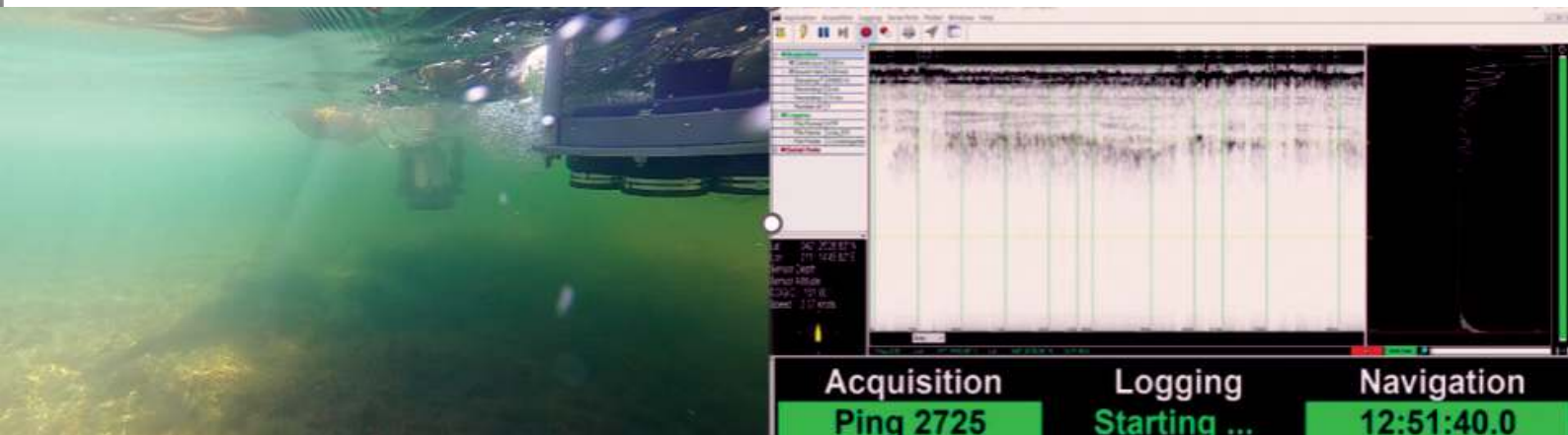
Figure 1. À gauche : photographie sous l'eau des imageurs de sédiment Echoes 3500 (installé sur mini-catamaran) et Echoes 10000 (installé sur perche). À droite : Logiciel Delph Geo d'Exail pour l'acquisition et visualisation en temps réel

Les cibles de ces projets sont notamment les ports de Pyrgi, Orbetello, Populonia et Talamone, en Étrurie. Pendant l'Antiquité, la côte étrusque est constituée d'une succession de grandes lagunes, séparées par des promontoires rocheux. Aucun bassin