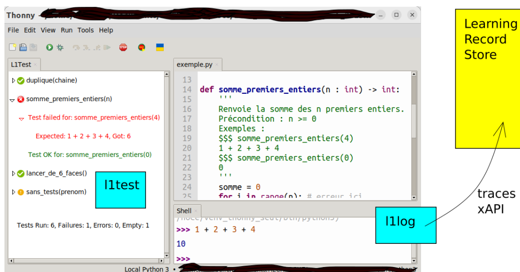
FIGURE 1 – Environnement Thonny et ses greffons

Les fonctionnalités de Thonny peuvent être étendues par un mécanisme de greffons que nous avons utilisé. La figure 1 présente l'interface globale de l'environnement ainsi que les deux greffons ajoutés qui sont décrits dans la suite. Thonny se présente sous la forme d'une interface graphique (Tkinter) avec une fenêtre principale contenant une fenêtre d'édition de code, une fenêtre contenant une console Python, ainsi que des boutons permettant notamment d'exécuter le contenu de l'éditeur.