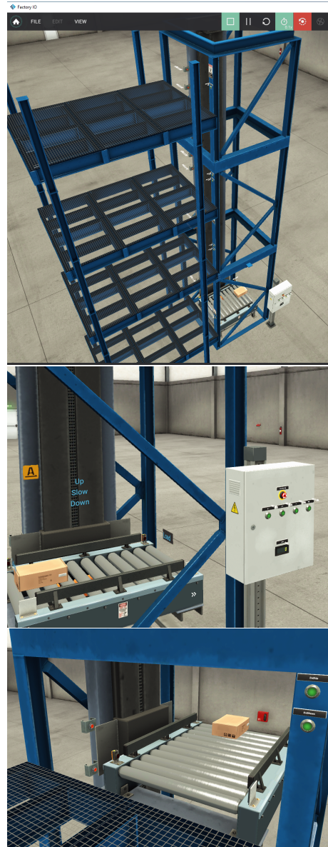
Vue de la simulation d'ascenseur

Pour faire le TP à distance, les étudiants disposent de Factory I/O et du logiciel Unity Pro de Schneider (devenu EcoStruxure control expert) en version étudiant en utilisant le mode simulation de l'automate. La communication entre ce dernier et Factory I/O se fait avec le