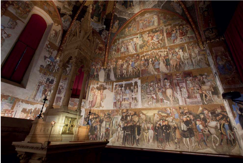
Chapelle de Théodelinde, dans la cathédrale de Monza (Italie), 2016 : vue de la paroi sud. La chapelle a été éclairée par l'agence Consuline, architectes Francesco Iannone et Serena Tellini, 2016.