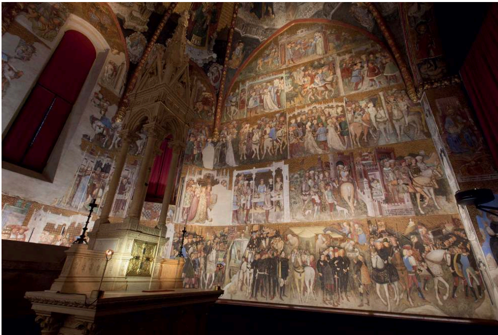
Chapelle de Théodelinde, dans la cathédrale de Monza (Italie), 2016 : vue de la paroi sud. La chapelle a été éclairée par l'agence Consuline, architectes Francesco Iannone et Serena Tellini, 2016.