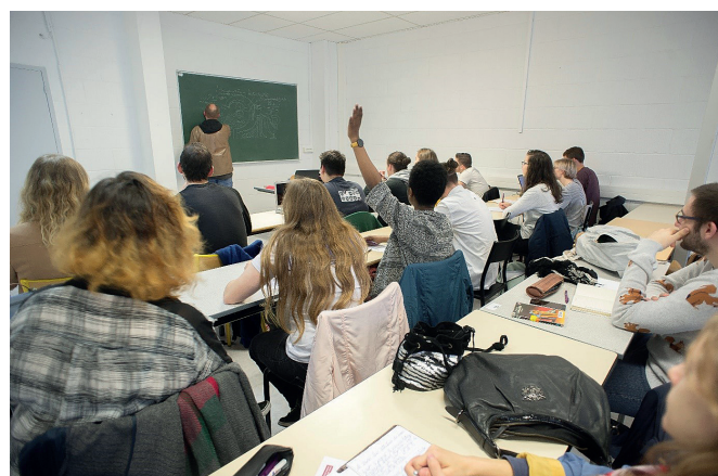
Étudiants en cours.