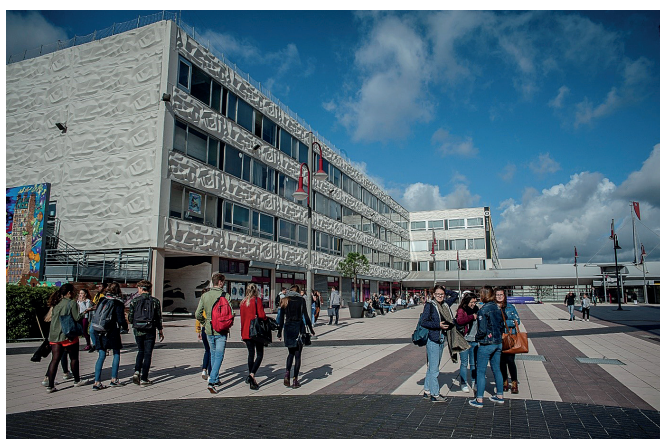
Le campus Pont de Bois.