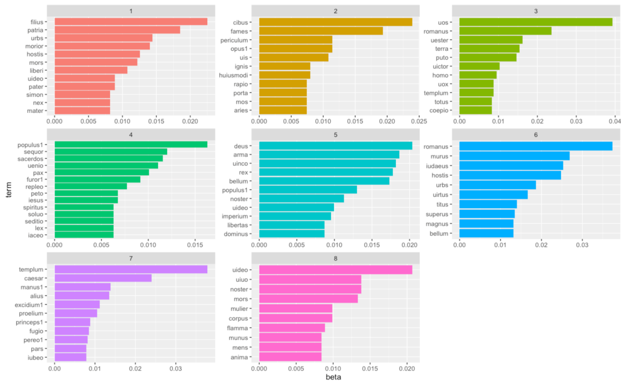
Fig. 2 : Les huit sujets obtenus avec le \beta de chaque lemme associé au sujet pour les Historiae du Pseudo-Hégésippe, livre V.