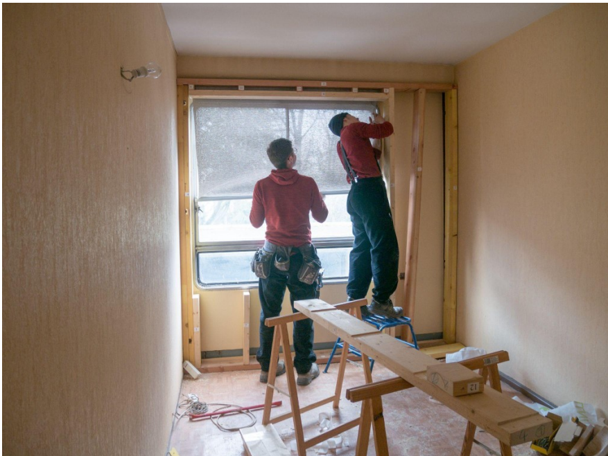
© Mathilde Padilla - Les Compagnons du Devoir de Villefontaine montant les prototypes in situ

Tous sont installés dans un logement vacant de l'immeuble permettant d'éprouver leur mise en œuvre, de tester leurs performances en conditions réelles et de recueillir l'avis des habitants. Il s'agit donc de véritables outils de conception collaborative qui permettent de redéfinir le projet afin de l'adapter à son contexte, aux enjeux d'un existant et aux besoins des habitants.