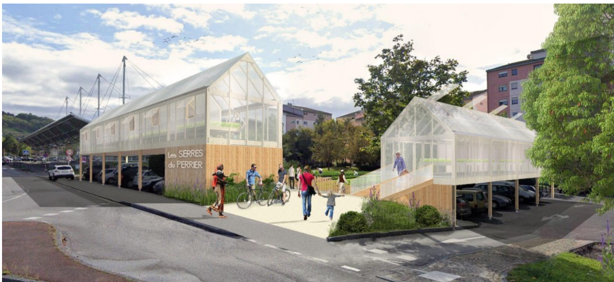
© Rémi Junquera - Illustration de deux serres agricoles hors-sol à Annemasse

La plus grande difficulté rencontrée, hormis la situation de crise sanitaire et ses impacts sur l'approvisionnement en matériaux, se situe dans le portage du projet. Une telle échelle de prototype avec ce niveau avancé d'opérationnalité peut inquiéter la maîtrise d'ouvrage qui doit faire face à la méconnaissance du monde de la construction prototypale et à une dimension administrative et juridique à inventer. L'expérimentation prototypale n'est pas uniquement constructive, architecturale, urbaine ou agricole, mais également et surtout opérationnelle, administrative et juridique. Ainsi, le montage de prototype est une expérimentation en soi. Il faut alors sortir des sentiers battus ce qui induit une certaine complexité mais également de l'enthousiasme dans la mesure où il faut rechercher, innover et remettre en question les manières de porter un projet.