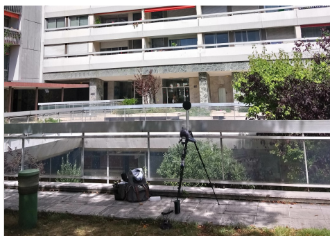
Captation sonore et mesures acoustiques, îlot urbain à Paris, photographie Charlotte Laffont.