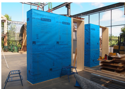
Fabrication des prototypes aux GAIA, photographie Charlotte Laffont, septembre 2022.