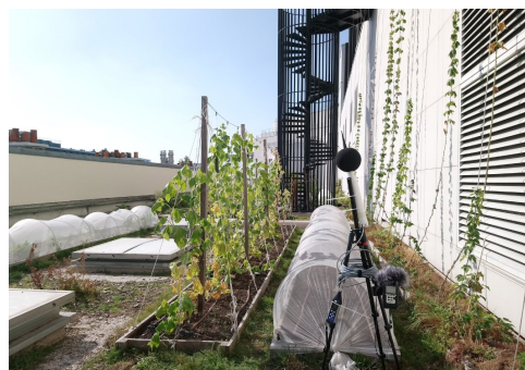
Captations sonores et mesures acoustiques, Opéra Bastille à Paris.