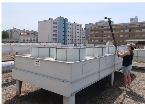
Captations et mesures acoustiques sur une toiture technique à Villeurbanne, photographie LASA.