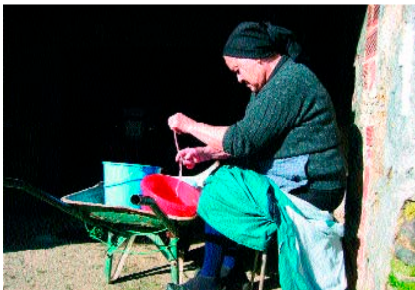
Figura 10. Mujer limpiando tripas (29 de enero de 2004).