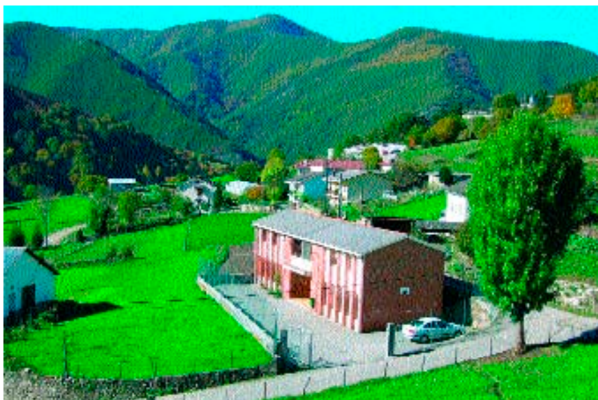
Figura 6. Escuela (12 de enero de 2004).