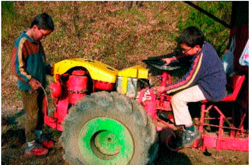
Figura 12. Dos hermanos jugando con el tractor del padre en un pueblo de la parroquia (15 de febrero de 2004).