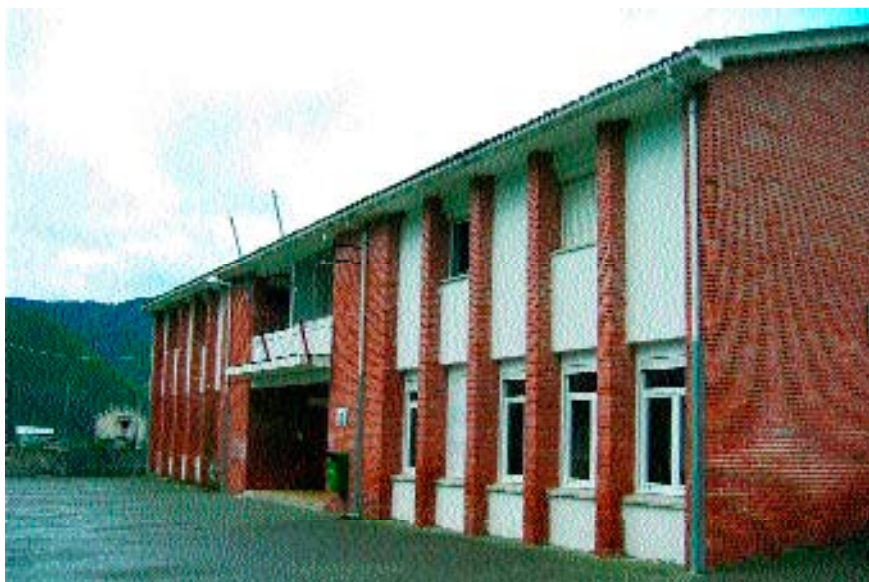
Figura 5. Escuela (4 de noviembre de 2004).