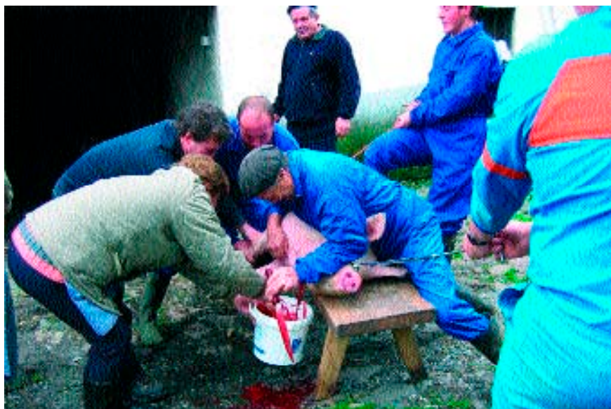
Figura 9. Matanza en Monasterio de Hermo (9 de diciembre de 2003).