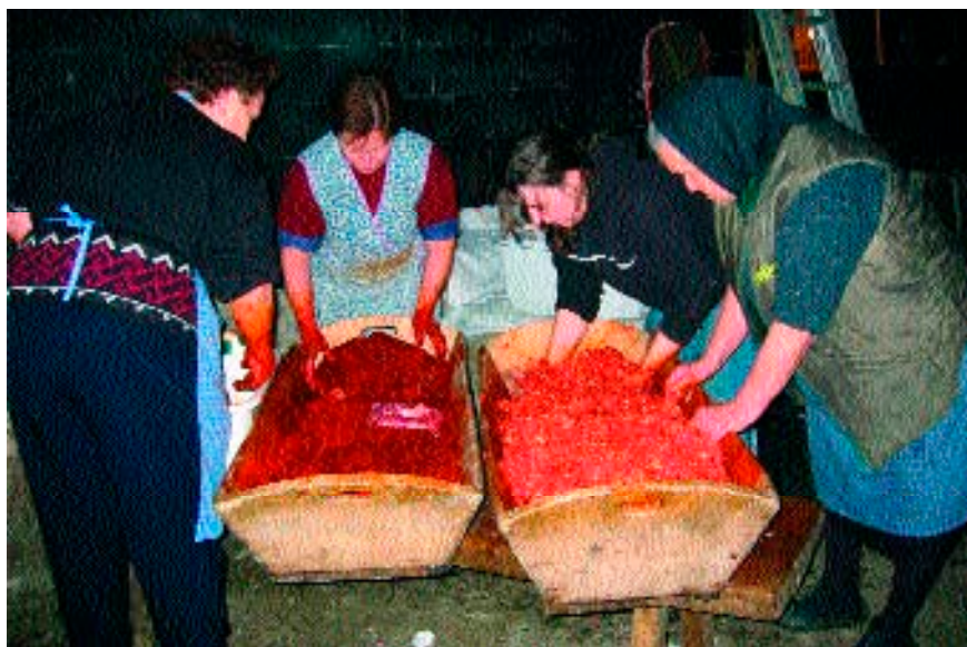
Figura 3. Una familia del pueblo rellena dos tipos de chorizo (31 de enero de 2004).