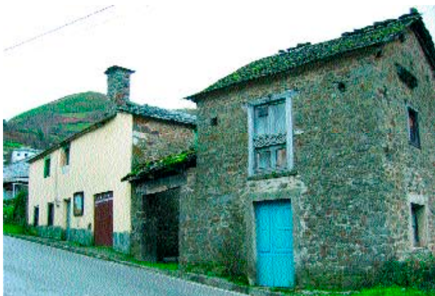
Figura 4. Escuela vieja (12 de enero de 2004).