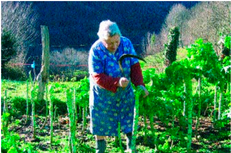
Figura 8. Mujer en la huerta (20 de enero de 2004).