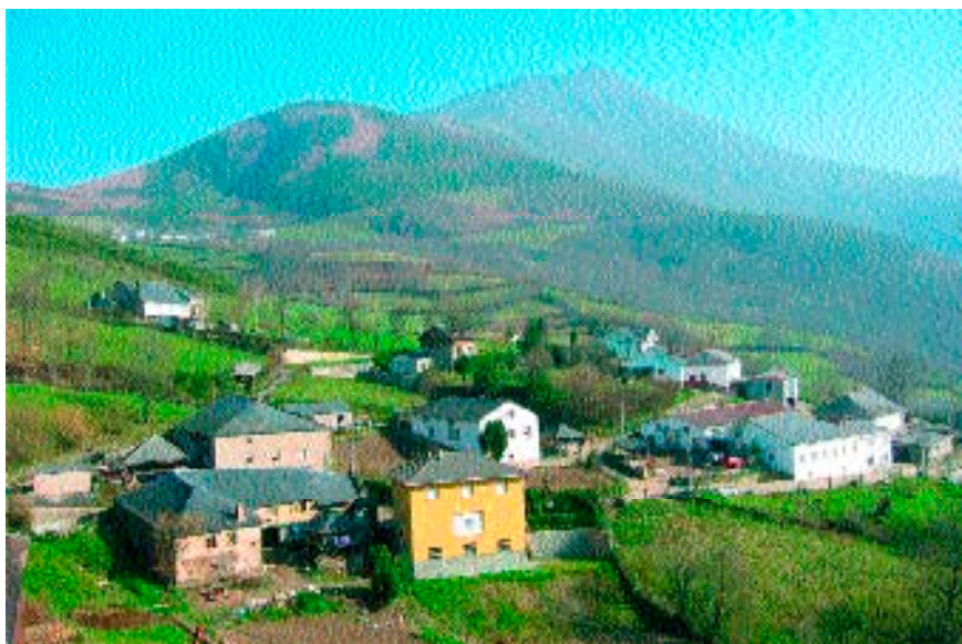
Figura 1. Dos pueblos de la parroquia (15 de febrero de 2004).