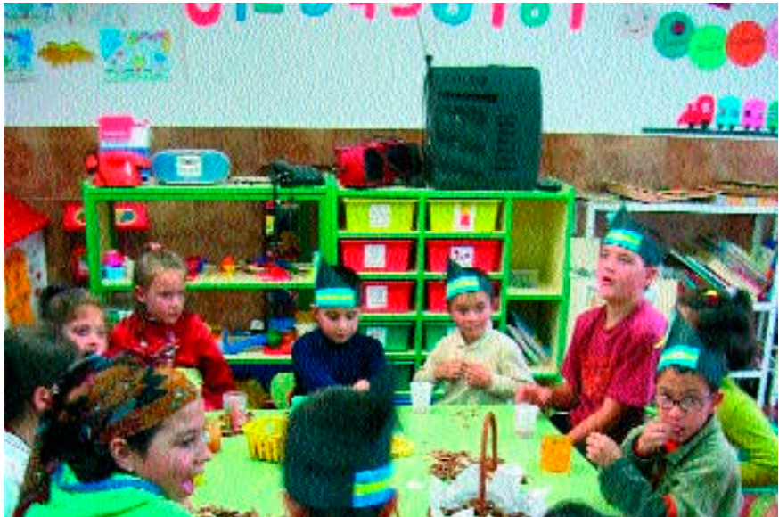
Figura 7. Alumnos de las dos aulas celebrando el amagosto (11 de noviembre de 2004).