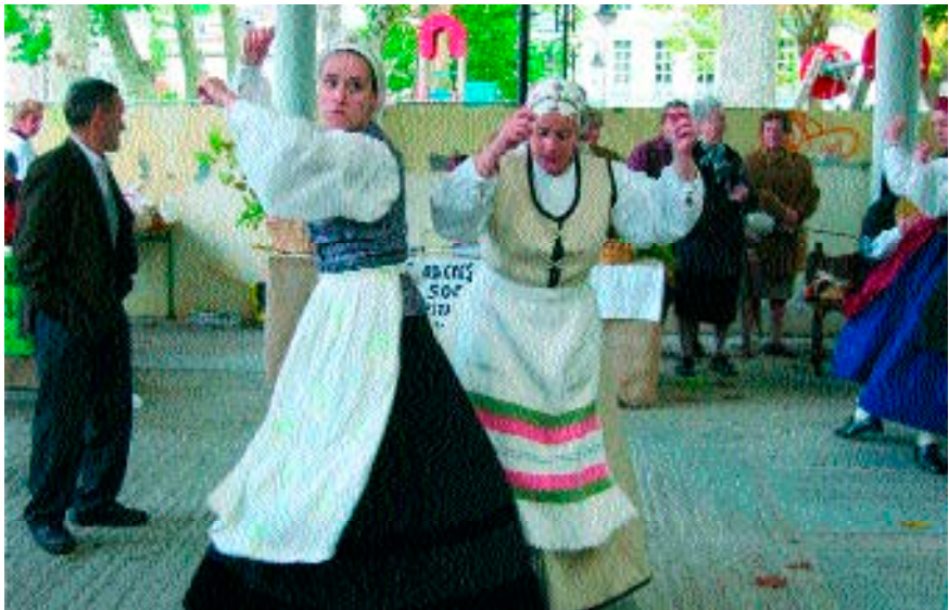
Figuras 13-16. Agrupaciones juveniles de gaita y baile en la Feria de Otoño de Pola de Allande (2 de noviembre del 2003). Son agrupaciones que mantienen contacto permanente con la del pueblo y desarrollan actividades en conjunto. También son invitadas a participar en la festividad que se lleva a cabo todos los años en el pueblo.