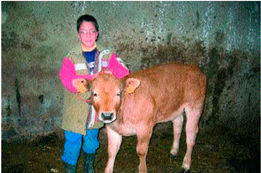
Figura 11. Niño en la cuadra de su casa en un pueblo de la parroquia (18 de enero de 2004).