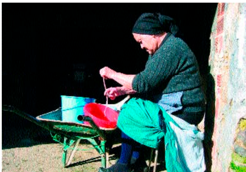
Figura 10. Mujer limpiando tripas (29 de enero de 2004).