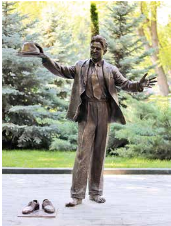
4. Oleksandr Ridnyi, Pamiatnyk Newydymsi ta Lesiu Kurbasu [Monument à l'homme invisible et à Les Kurbas], 2019, bronze, grandeur nature, Kharkiv, parc Taras-Chevtchenko.

Le film Monument retrace le démantèlement en 2011 du Pamiatnyk proholoshenniu radianskoi vlady v Ukraini (Monument à la proclamation du pouvoir soviétique en Ukraine) de Kharkiv, une sculpture de dix-huit mètres de hauteur en granit rouge. Mettant en scène dans un vocabulaire réaliste-socialiste des figures massives de prolétaires, de paysans et de soldats, elle avait été inaugurée en 1975 sur la place