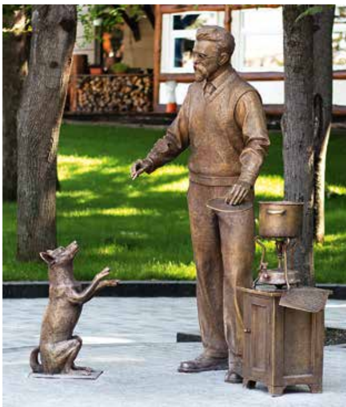
3. Oleksandr Ridnyi, Pamiatnyk akademiku Volodymyru Vernadskomu (Monument à l'académicien Vladimir Vernadsky), 2019, bronze, grandeur nature, Kharkiv, place de la Liberté.

Dans ses sculptures et installations, Ridnyi fils répond à la pratique de son père en poussant à son paroxysme cette subversion de la fonction célébratoire du monument. On peut notamment citer l'installation Monument / Platformy (Monument / Piédestaux), de 2011-2013, présentée en partie dans le Pavillon ukrainien de la Biennale de Venise en 2013 et composée d'un film et d'une série de sculptures 13 .