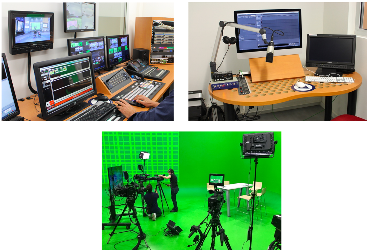
Figure 1. De gauche à droite : Régie 2 ; Cabine speak ; Plateau 2

Au second semestre, nous organisons des ateliers dans le cadre des travaux dirigés durant lesquels les étudiants élaborent le conducteur de leur talk-show sur la base du dossier livré en amont. L'émission est tournée dans une plateforme de production audiovisuelle et numérique (cf. figure 1). Le plateau accueille un studio virtuel et tous les dispositifs techniques (dernière génération) nécessaires à la réalisation. Les étudiants sont ainsi confrontés à l'environnement de travail des acteurs de l'organisation médiatique (éditorialisation, régie technique, décor virtuel, scénographie, diffusion...).