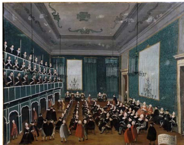
Figura 1. La cantata delle putte degli Ospitali: Gruppo di orfani raccolti negli Ospedali di Venezia e facenti parte di cori al tempo di Antonio Vivaldi. Dipinto di Gabriel Bella (1730 – 1799), Palazzo Querini Stampalia Venezia. In questa immagine, le putte stanno nel coro a volto scoperto e l'artista ha rappresentato un pubblico variegato, composto in parti uguali di uomini e donne.

Oratorii deliziosissimi che scritti in lingua latina metricamente, posti in musica dai più renovati musurgi ed accompagnati da pienissima orchestra, esse nel dopo pranzo d'ogni giornata festiva dall'alto de' chiusi lor cori eseguivano a gara nelle stesse lor Chiese dale quali [...] zeppe d'uditori che v'accorean da ogni lato [...]. Nei tre Ospitali, Incurabili, Mendicanti e Spedaletto, fiori contemporaneamente la musica; e nella continua lor gara or l'uno or l'altro avea su tre rivali: Trionfò il Pio Luogo La Pietà; sebben vi sedessero musurgi eccellentissimi: Gasparini, Porta, Vivaldi, Sarti, Furlanetti, dalla mediocrità non mai sollevassi nel canto, nei Oratorii, ma largamente vi si rifaceva non poco nel suono: La sua Orchestra era insuperabile (Caffi, 1850).