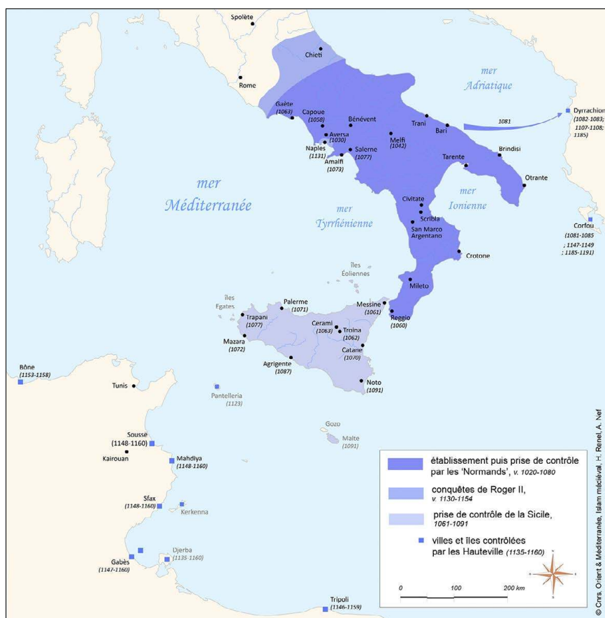
Fig. 1 – Les étapes de la construction normande en Méditerranée centrale

assume fortement cette diversité interne et cet expansionnisme 17 . Or, Georges d'Antioche, dont le rôle a été essentiel aux côtés de Roger 18 , même s'il convient d'imaginer un milieu plus vaste les entourant et collaborant à ce projet, a gagné la Sicile depuis l'Ifriqiya fatimide 19 .