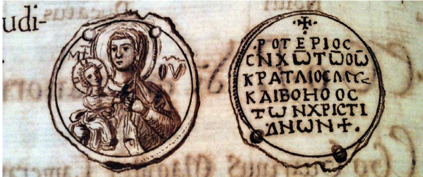
Fig. 4 – Dessin du sceau d’or autrefois apposé sur le document conservé à Montecassino, Aula III, Caps. X, 37

Archivio dell’Abbazia di Montecassino, Codex diplomaticus Cassinensis, II, fol. 66v. Cl. auteurs.