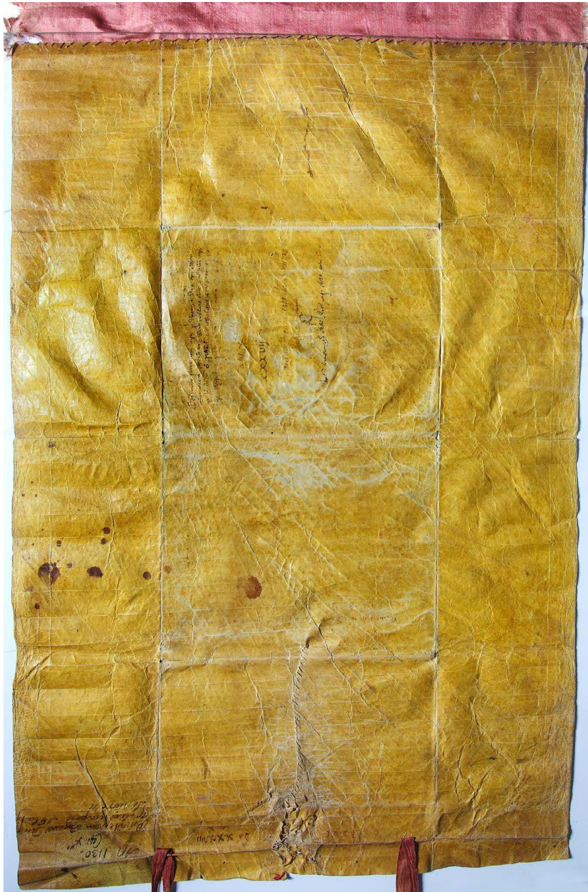
Fig. 3 – Acte de Roger II promulgué le 30 décembre 1129 à Palerme Archivio dell'Abbazia di Montecassino, Aula III, Caps. X, 37.