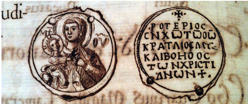
Fig. 4 – Dessin du sceau d’or autrefois apposé sur le document conservé à Montecassino, Aula III, Caps. X, 37

Archivio dell’Abbazia di Montecassino, Codex diplomaticus Cassinensis, II, fol. 66v.