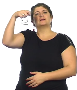
(a) forme pour "président/présidence" en LSF

Par exemple, en LSF, la règle de production président associe le sens 'président/présidence' à la forme illustrée en figure 1a. De même, la règle info-about , à deux arguments ( topic et info ), associe le sens ' info , à propos de topic ' à la synchronisation de formes présentée en figure 1b : les deux arguments sont placés en séquence et séparés par une durée contrôlée, chacun est maintenu ( hold ) sur une durée plus ou moins longue et un clignement des yeux ( el:cl ) se synchronise avec la fin du maintien d' info . Les différentes règles de production peuvent se combiner entre elles récursivement pour construire des expressions AZee de discours , qui reflètent le sens que l'on interprète à partir des formes qu'elles produisent. Un exemple d'une telle expression est donné en figure 1c : elle représente une production en LSF dont les formes correspondent à celles de la figure 1b, avec les règles président et célèbre respectivement en topic et info , et signifie « [le/un] président est célèbre ».