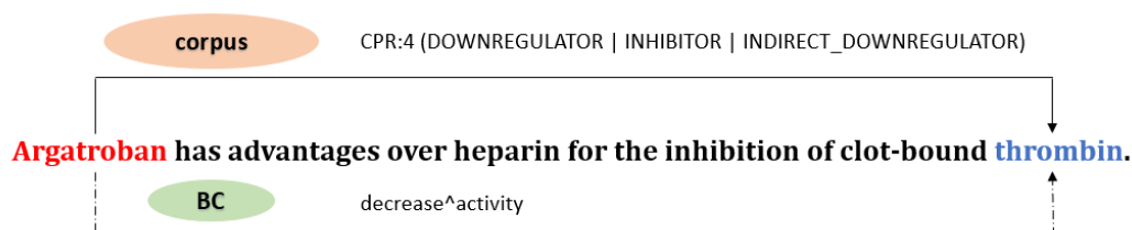
FIGURE 1 – Un exemple venant du corpus d'extraction de relations ChemProt (Krallinger et al. , 2017). Une relation "CPR:4" est annotée dans la phrase entre Argatroban et thrombin ; on trouve une relation "decrease^activity" entre ces entités dans la BC externe CTD (Davis et al. , 2023).

L'extraction de relations est une tâche importante du traitement automatique des langues sur laquelle de nombreuses études existent. Elle consiste à identifier le type de relation entre une paire d'entités étant donné une phrase entière. Un exemple d'extraction de relations est montré dans la figure 1 : l'objectif est de déterminer quelle relation existe entre Argatroban et thrombin , par exemple CPR:4 .