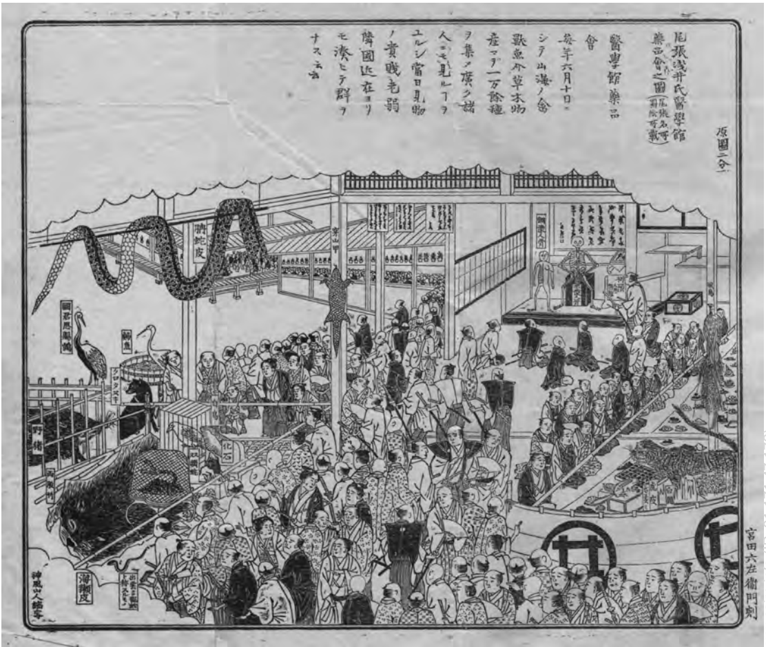
Fig. 2. Illustration d'un bussankai de l'ère Tenpō (1831-1845) tiré de Owari meisho zue et reproduite dans Nihon hakubutsukan-gaku nenpyō 日本博物館學年表, 1908, p. 16. Disponible en ligne : [http://dl.ndl.go.jp/info:ndljp/pid/1870590/16].

Peut-être encore plus intéressant, et bien qu'encore une fois il ne s'agisse pas à proprement parler de musée, les expositions des grands magasins sont une pratique qui mérite quelque peu que l'on s'y attarde, d'autant qu'elles semblent tenir une place importante, et ce de manière unique au Japon. Importés de l'Occident, les grands magasins tels que les actuels Mitsukoshi ou Takashimaya, pour ne citer que les plus connus, voient le jour au tout début du XX e siècle. Dès leurs origines, ils organisent des expositions (1909 pour Mitsukoshi), se dotent d'espaces conçus et désignés à cet effet et certaines de ces galeries se transformeront par la suite en musée. Les expositions peuvent être de natures très diverses : de l'exposition de cultures étrangères à l'exposition artistique, en passant par des expositions scientifiques ou