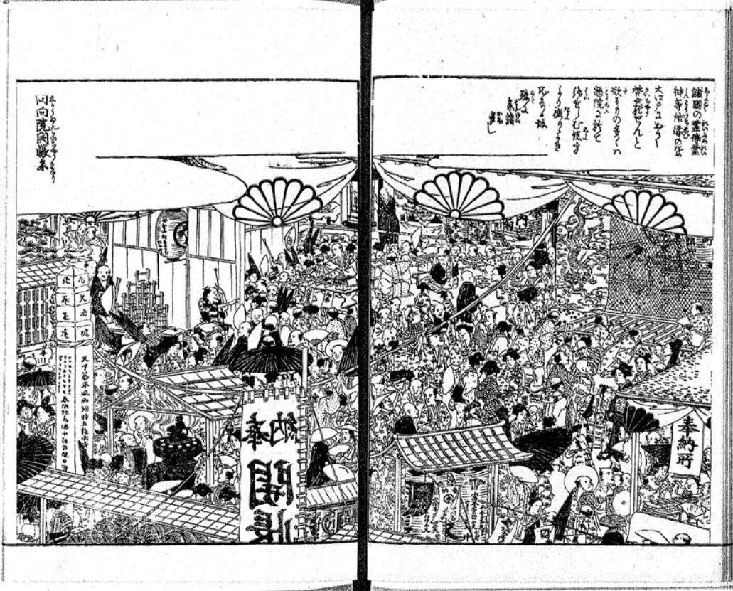
Fig. 1. Illustration d'un kaichō au temple de Ekō ( Ekō-in ) dans le Edo meisho zue , vol. 18, p. 31. Source : Bibliothèque nationale de la Diète du Japon. Disponible en ligne : [http://dl.ndl.go.jp/info:ndljp/pid/994947].

Profitant de l'attraction générée par les kaichō , ces entreprises du savoir et du divertissement fleurissent et nous montrent une plus large étendue des pratiques « expositionnelles » avant l'apparition du musée occidental. Par ailleurs, concernant les rassemblements des lettrés, Fukui Yōko nous montre qu'il n'était pas rare que les professionnels des misemono soient les organisateurs de ces manifestations et que spécimens minéraux, zoologiques et botaniques y côtoyaient des objets de type archéologique, ou encore des objets du quotidien 26 . Les bussankai , à la fin de l'époque d'Edo, dépassèrent le simple cadre des lettrés et devinrent des lieux de rassemblement populaire. Que les membres des associations comme la Shabenkai , qui réunissait des seigneurs lettrés et organisait ces réunions, aient été appelées à participer à l'organisation des premières expositions industrielles du Japon ne manque pas d'attiser notre curiosité concernant l'influence de ces pratiques autochtones sur le musée japonais moderne.