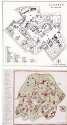
Fig. 2-3 : Plan du projet pour l'ethno-musée japonais par Kon Wajirō. Plan du musée de Skansen. YOKOHAMA-SHI REKISHI HAKUBUTSUKAN et KANAGAWA DAIGAKU NIHON JŌMIN BUNKA KENKYŪ-JO (éds.) 2002, Yaneura no hakubutsukan : jitsugyōka Shibusawa Keizō ga sodateta tami no gakumon (Le musée du grenier : la science du peuple 'tami' développée par l'homme d'affaire Shibusawa Keizō), Yokohama, Musée d'histoire de la ville de Yokohama, p. 121.

Dans le texte proposé au Comité préparatoire des commémorations du 2600e anniversaire de la fondation du Japon, est soulignée la nécessité pour le Japon de se doter d'infrastructures similaires à celles qu'on trouve en Occident. Le musée est en effet pensé comme un institut de recherche et d'enseignement destiné au peuple, mais également comme une vitrine vis-à-vis de l'étranger.