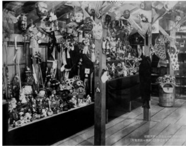
Fig. 1 : Objets entreposés par l'Attic museum avant le déménagement à l'ouest de Tokyo. KOKURITSU MINZOKUGAKU HAKUBUTSUKAN (éd.) 2013, Yaneura-beya no hakubutsukan : Shibusawa Keizō no botsugo 50 nen : Attic museum (Attic museum : cinquantenaire de la mort de Shibusawa Keizō : le musée du grenier), Kyoto, Tankosha, p. 23. [Catalogue d'exposition]

L'espace venant à manquer pour entreposer ces objets, un terrain est acheté à Hōya 保谷 (à l'ouest de Tokyo) en 1936, l'année même où le projet d'ethno-musée a été soumis. Ce projet d'ethno-musée était bâti sur le noyau originel des collections de l'Attic museum. En effet, le Comité pour l'établissement de l'ethno-musée, composé des membres de l'Attic museum et de personnalités gravitant autour ou faisant partie de la Société japonaise d'ethnologie, proposait de céder ce terrain et leurs collections tandis que l'État se chargerait d'assurer au musée une dotation annuelle garantissant son fonctionnement. Le projet envisageait également une exposition de plein air sur le modèle du musée de Skansen en Suède, cher à Shibusawa et qu'il avait visité lors de son séjour en Europe au début des années 1920 (fig.2-3).