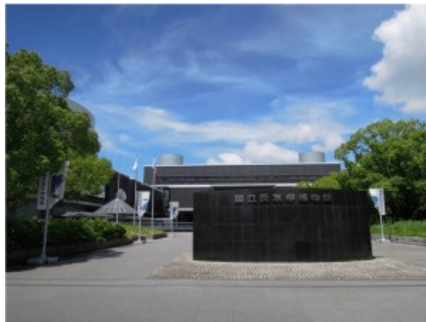
Fig. 6 : Photographie du Minpaku, 2011.

En juin 1974, la fondation du musée est officialisée ; le bâtiment accueille les collections à partir de janvier 1977, et le musée ouvre ses portes au public le 17 novembre de la même année (fig. 6).