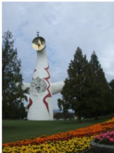
Fig. 4 : La Tour du soleil, 2010.

L'Exposition universelle d'Osaka, en 1970, sert de tremplin au projet du Minpaku en offrant un terrain sur ce qui devient, après la tenue de la manifestation, le Parc commémoratif de l'Exposition universelle. Si le Minpaku est envisagé sur ce terrain, c'est notamment en raison du pavillon thématique japonais auquel Umeao T. et Izumi S. avaient participé. Ce pavillon, dirigé par l'artiste Okamoto Tarō 岡本太郎 (1911-1996) avait eu pour thématique l'évolution de l'humanité. Il n'en reste aujourd'hui que la bâtisse, « La Tour du Soleil » 太陽の塔 (Taiyō no tō), qui est devenu le symbole du Parc (fig. 4. 5.).