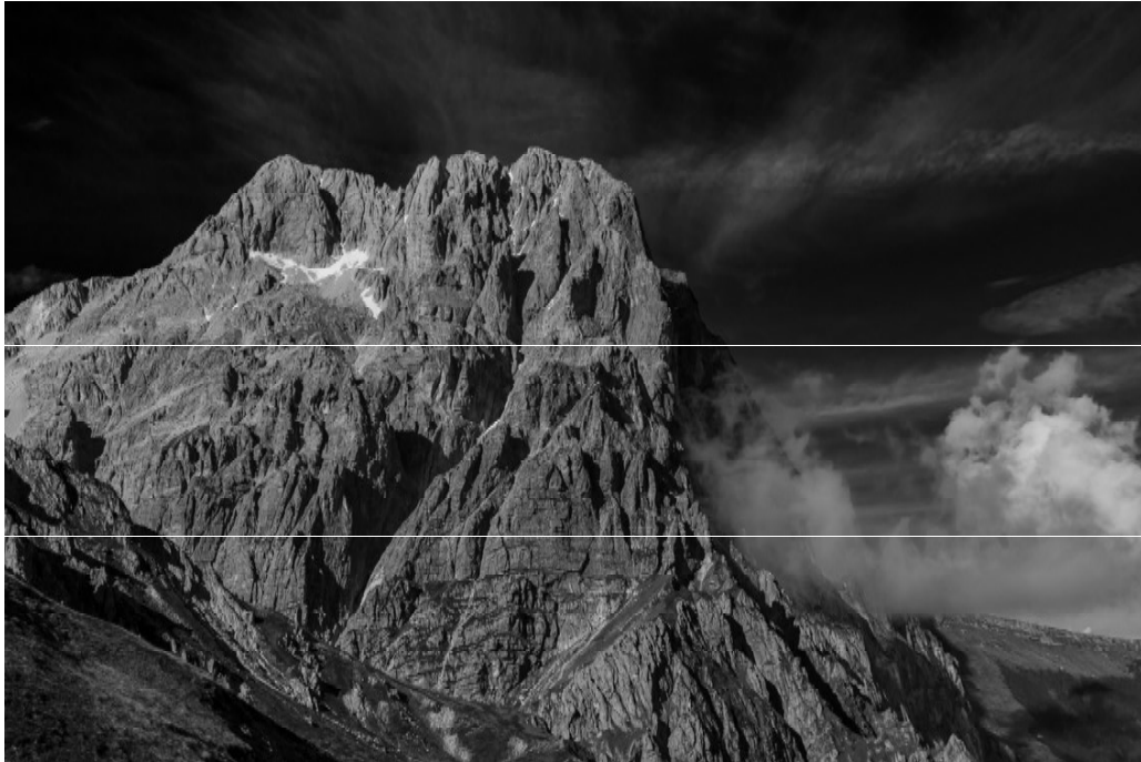
Campo Imperatore