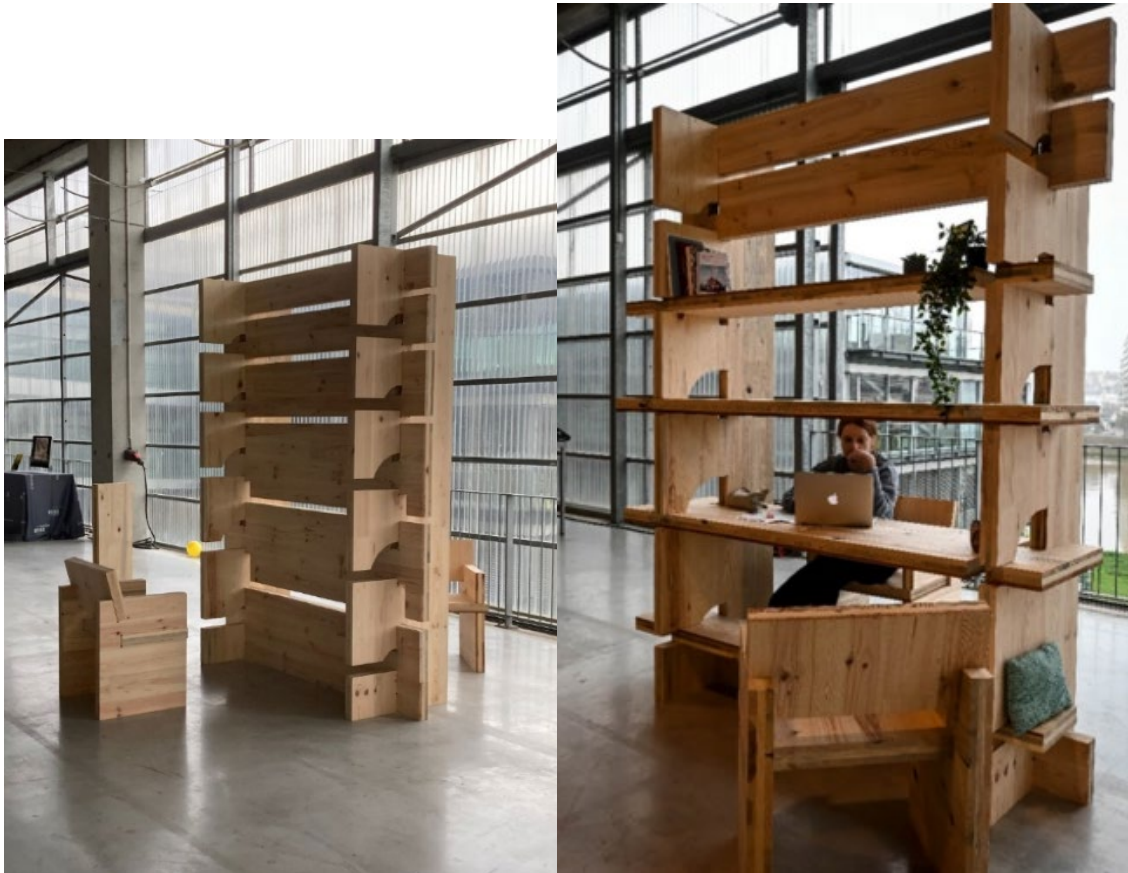
Figure 3 : Le basculator – Apolline Catté, Bianca Fox, Lara Fügenschuh, Salomé Tréhin (Etudiants ENSA Nantes 2021/2022) – Novembre 2021, ENSA Nantes.

réalisations de réserves ont été nécessaires pour optimiser les systèmes d'assemblages.