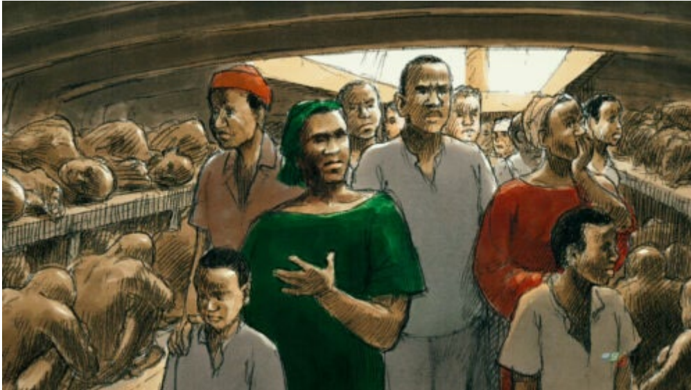
Figure 3 : Image d'ambiance de la visite des cales du « Bateau du Départ ». La gestuelle des deux femmes, au premier plan, est particulièrement éloquente : une main sur le cœur, une main sur la bouche. C'est l'émotion qui est visée et l'inexprimable qui est traduit.

Quel degré de réalisme est-il nécessaire de présenter ? Est-il opportun d'être aussi « brut » et brutal dans la représentation de ces figures avilies, vilipendées ?