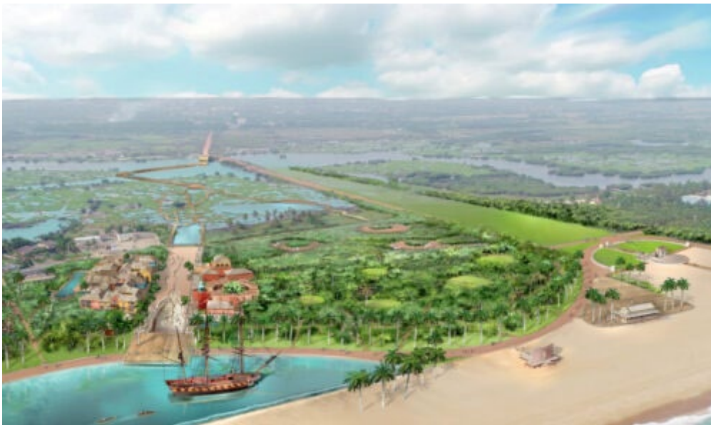
Figure 2 : Image d'ambiance du réaménagement de la plage de Djegbadji

La « nouvelle version » de la Route de l'Esclave proposerait aux visiteurs de découvrir et parcourir l'histoire négrière de la ville de Ouidah à travers la reconstitution ou la réhabilitation de sites marquants (le fort portugais, la Case Zomaï, la Place des Enchères), l'édification de la réplique d'un navire négrier et la représentation de scènes historiques avec des modelages de personnages (scènes de vente, de marquage ou de convoi d'esclavisé.e.s). L'objectif est d'accentuer la « mise en situation » des visiteurs en créant un décor qui correspondrait à ce qu'aurait été le contexte urbain et paysager que traversaient les captifs.