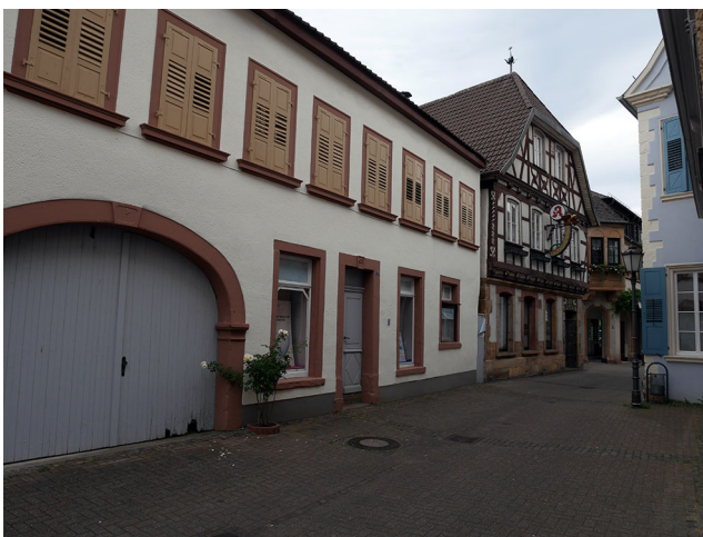
Abb. 5 Leerstand mit halbhoheren Schaufenstern in der Fußgängerzone Bad Bergzabern 2021.

Leerstand bei bodentiefen Schaufenstern stark negativ in den Bereich der Fußgängerzone strahlt (Abb. 3b), sind die Effekte bei halbhoheren Schaufenstern weniger stark ausgeprägt (Abb. 5).