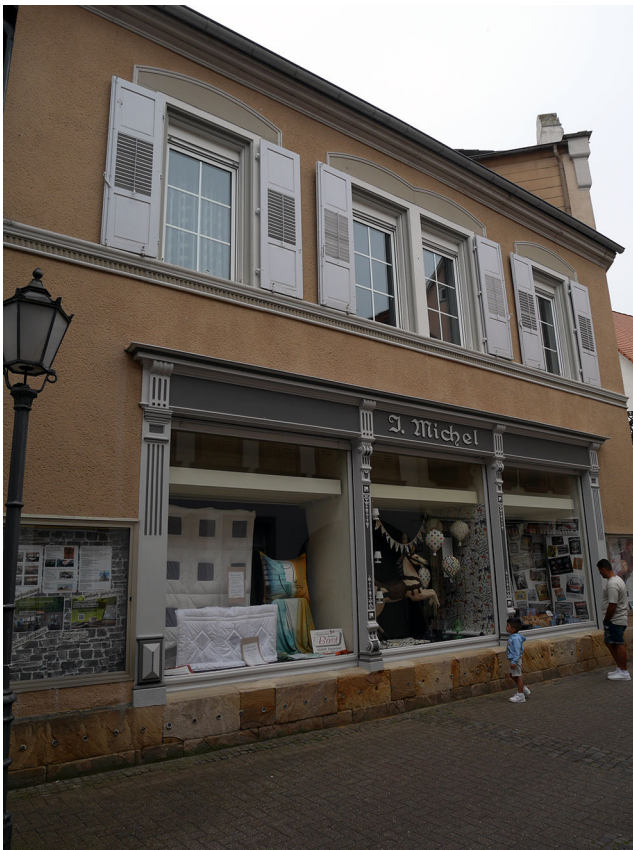
Abb. 4 Bespielter Leerstand mit interessierten Passant:innen in der Fußgängerzone Bad Bergzabern 2021.

Leerstand bei bodentiefen Schaufenstern stark negativ in den Bereich der Fußgängerzone strahlt (Abb. 3b), sind die Effekte bei halbhoheren Schaufenstern weniger stark ausgeprägt (Abb. 5).