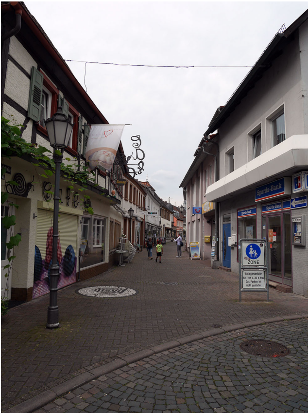
Abb. 2 Östlicher Zugang Fußgängerzone Bad Bergzabern mit Bebauung aus den 1970er-Jahren.

neben historischen Gebäuden von einigen Bauten aus den 1970er-Jahren gerahmt ist (Abb. 2).