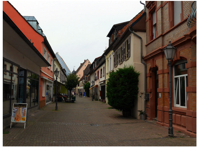
Abb. 6 Mittlerer Teil der Fußgängerzone Bad Bergzabern mit Begrünung.

Die Fallstudie hat außerdem verdeutlicht, dass die Einbettung eines Leerstandes in eine attraktive Umgebung die negativen Effekte abschwächt. Der mittlere Teil der Fußgängerzone – mit einigen attraktiven Geschäften, attraktiven Fassaden sowie einer gepflegten Bepflanzung und Begrünung – wurde von den Proband:innen trotz mehr als der Hälfte leerstehender Ladenlokale tendenziell als positiv erlebt (Abb. 6).