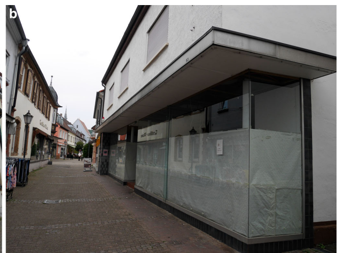
Abb. 3 a Beispiel einer Leerstandsfläche in der Fußgängerzone Bad Bergzabern 2021 (Foto: H. Rapp). b Leerstand mit zugleblenen, bodentiefen Schaufenstern in der Fußgängerzone von Bad Bergzabern 2021. (Foto: H. Rapp)