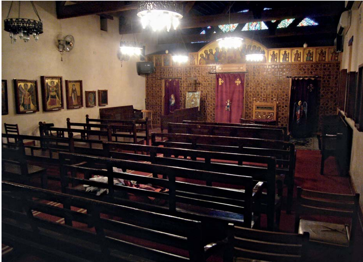
Pl. 2. Vue actuelle de l'église Saint-Jean-de-Senhout, monastère Saint-Ménas, Le Caire

manteau, un tablier de cuir tenu en bandoulière sur l'épaule gauche et une longue écharpe étroite décorée de deux paires de petites croix, tombant de cette même épaule. Le saint personnage est représenté pieds nus. Les travaux sur ces peintures particulièrement bien conservées ont permis une datation aux alentours de 465, soit très proche de la mort de l'archimandrite, indiquant ainsi une vénération très précoce 11 .