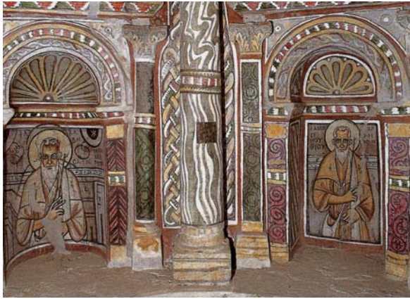
Pl. 3. Saint Chenouté et saint Besa, sanctuaire principal, moitié ouest du registre médian, lobe nord, église Saint-Bishoy, monastère Rouge de Sobag (Bolman 2006, Pl. 17)