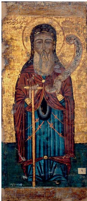
Pl. 10. Attribué à Ibrahim al-Nasikh, Saint Antoine, M.C. 3434, Musée copte, Le Caire