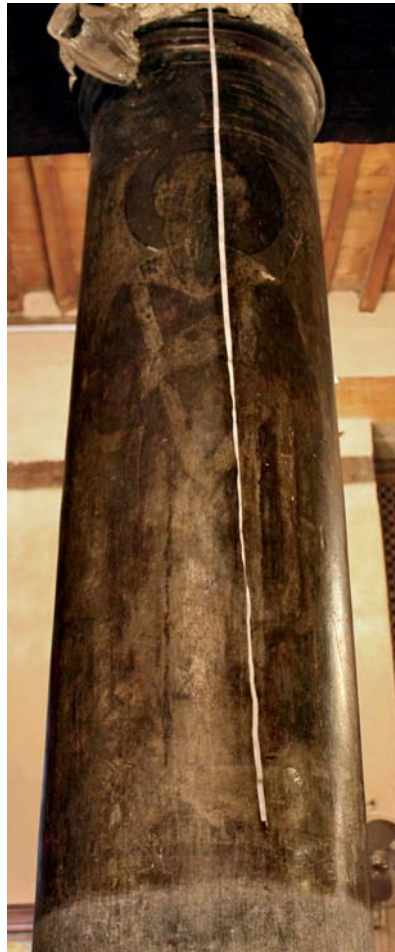
Pl. 6. Saint Chenouté, église Saint-Chenouté, Le Caire