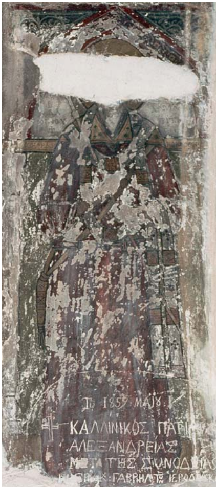
Pl. 5. Saint Chenouté, 1232-1233, monastère Saint-Antoine de la mer Rouge