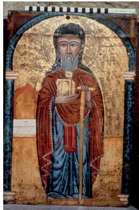
Pl. 11. Yuhanna al-Armani, Saint Takla Haymanot, église Saint-Mercure, monastère Saint-Mercure, Le Caire