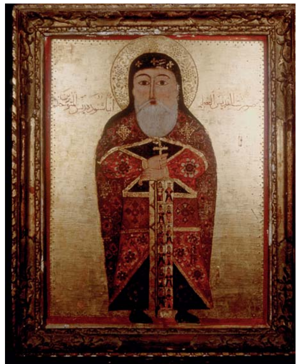
Pl. 7. Saint Chenouté, XVII e siècle, église Saint-Mercure, monastère Saint-Mercure, Le Caire

Nous l'avons évoqué dans la description du panneau, saint Chenouté est ici figuré seul. Ceci n'est pas sans nous rappeler un panneau représentant ce même saint conservé dans l'église Saint-Chenouté du monastère Saint-Mercure au Caire (Pl. 7) 31 . Celui-ci, selon des critères stylistiques 32 , peut être daté du XVII e siècle et représente l'abbé du monastère Blanc de Sohag debout, seul, paré de riches vêtements liturgiques chamarrés, tenant un bâton à l'extrémité en tau et une croix de bénédiction. Tous les signes de son autorité sont ici réunis au même titre que l'icône décrite précédemment.