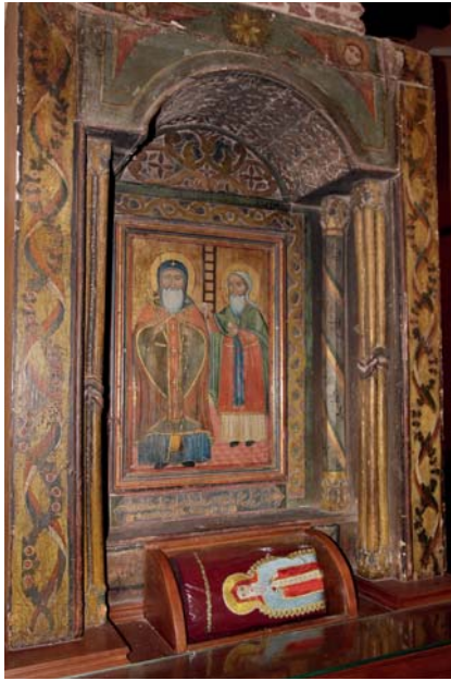
Pl. 8. Anastasi al-Rumi, Saint Chenouté, église Saint-Chenouté, monastère Saint-Mercure, Le Caire