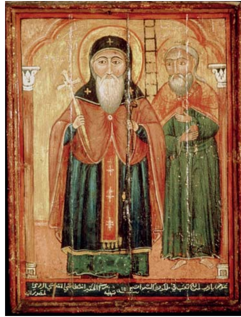
Pl. 9. Anastasi al-Rumi, Saint Chenouté, église Saint-Mercure, monastère Saint-Mercure, Le Caire