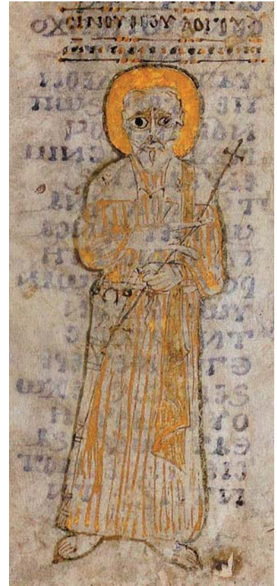
Pl. 4. Portrait en pied de Chenouté, parchemin, XI e siècle (?), monastère Blanc, Paris, Bibliothèque nationale de France, Ms. Copte 1305, fol. 128v (Catalogue Paris 2004, pl. sur p. 49)