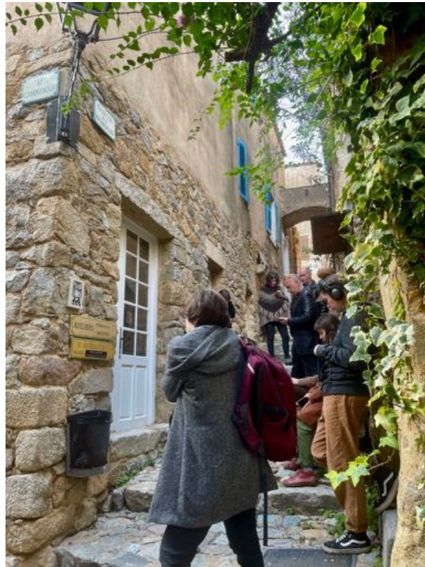
Public écoutant lors de l'inauguration , 23/02/2023.

« Je pense que pour les touristes ça va leur donner une image encore plus culturelle et un rapport plus profond au village, plutôt que simplement commercial. Ça peut en très peu de temps donner une dimension sociale et culturelle, même sans explications, ça montre un travail. »